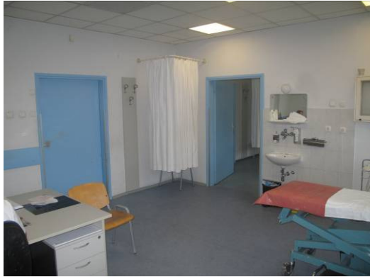
Slika 7. Hitna kirurška ambulanta