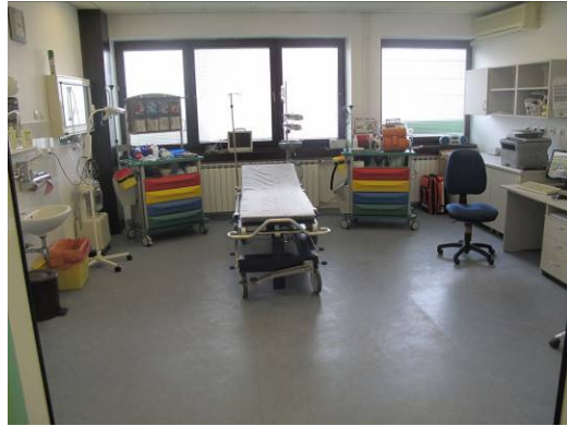
Slika 8. Danas prostor reanimacije