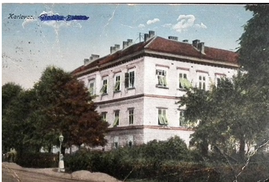
Slika 1. Gradska javna bolnica na Dubovcu

broja bolesnika, tako se dešava da dva bolesnika leže u istom krevetu o čemu se vodila posebna statistika. Zaključeno je da se treba izgraditi nova bolnička zgrada, slijedom toga 1961. godine prihvaćen je projekt, a 1962. godine započinje izgradnja nove zgrade. Zbog pomanjkanja sredstava radovi na neko vrijeme staju. Inicijativom lokalnih vlasti raspisuje se samodoprinos za gradnju bolnice i 1969. godine završava prva etapa izgradnje Bolnice na Švarči. Druga etapa završava 1974. godine, a treća etapa 1976. godine. Radovi na modernoj bolnici kontinuirano traju sve do 1990. godine kada se završava izgradnja poliklinike. U novoj zgradi smješteni su svi odjeli i službe (Pavan 2006).