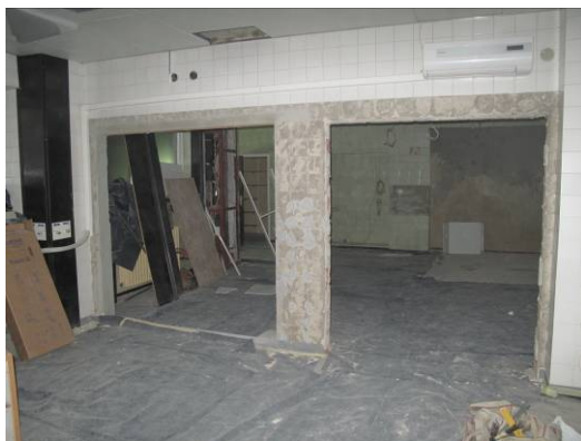
Slika 9. Prostori spremišta