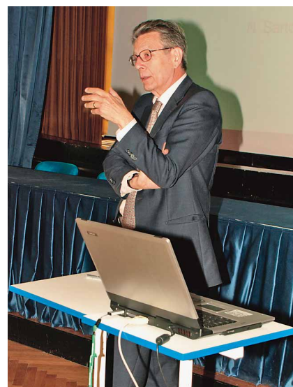
Predavanje u bolnici Vrapče, 2017. godine

jeme profesor Jakovljević je u cijelosti preuzeo uređivanje časopisa.