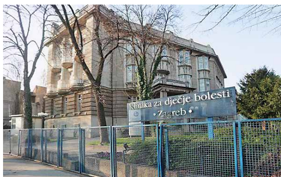
Bolnica za dječje bolesti, Zagreb, arhitekt Ignjat Fischer

Tijekom mojega studija medicine nastava iz psihijatrije je uključivala seriju teorijskih predavanja uz koja su se povremeno studentima prikazivali pojedini bolesnici s tipičnim psihijatrijskim bolestima. Osim toga posjetili smo psihijatrijsku bolnicu i odjel psihijatrije, slijedeći na viziti odjelne liječnike od jedne do druge bolesničke