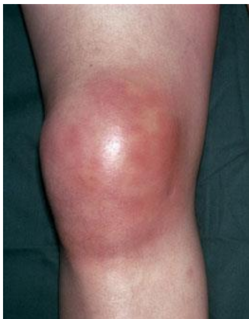
Slika 5. Gnojni artritis desnog koljena

se ti znakovi ne vide na zglobu kuka, zbog njegovog dubljeg smještaja. Simptomi koji prate zahvaćenost kuka su antalglična pozicija i bol kod manje djece, te prestanak hodanja ili hod uz šepanje i bolove kod veće djece (Šoša et al. 2007.).