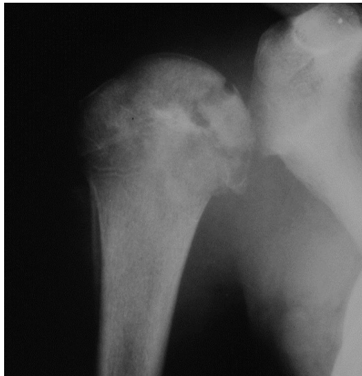
Slika 6. Anteroposteriorni RTG snimak ramenog zgloba, sa subhondralnim erozijama i sklerozom glave humerusa