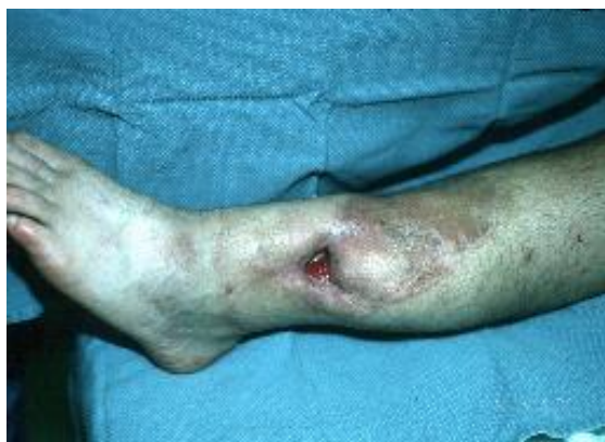
Slika 1. Osteomijelitis odrasle osobe

otvoriti, a bolovi će nestati ili se smanjiti, do njezina ponovnog otvaranja. Koža oko žarišta je stanjena, smečkastoljubičaste boje, sjajna, a na palpaciju mekana. Ostali znakovi osteomijelitisa uključuju deformitete kostiju, nestabilnost te lokalne znakove narušene vaskularne opskrbe (slika 1) ( Šoša et al. 2007.).