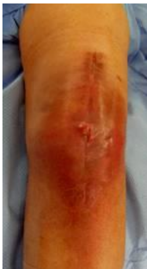
Slika 9. inficirana proteza koljenskog zgloba