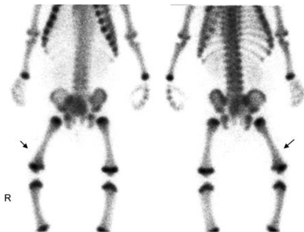
Slika 4. Scintigrafija skeleta – dječak u dobi od 6 mjeseci, sa osteomijelitisom desnoga femura