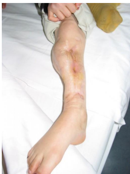
Slika 2. Akutni osteomijelitis u djeteta