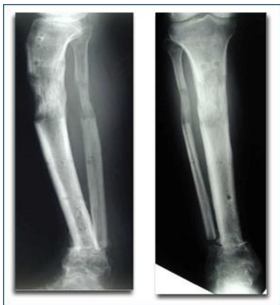
Slika 3. Anteroposteriorni RTG snimak potkoljenice – osteomijelitis prije i nakon terapije kod 31 - godišnjeg pacijenta, nakon skijaške ozljede

U diferencijalnoj dijagnozi treba sumnjati na akutnu leukemiju, celulitis i maligne tumore kosti (Ewingov sarkom, osteosarkom).