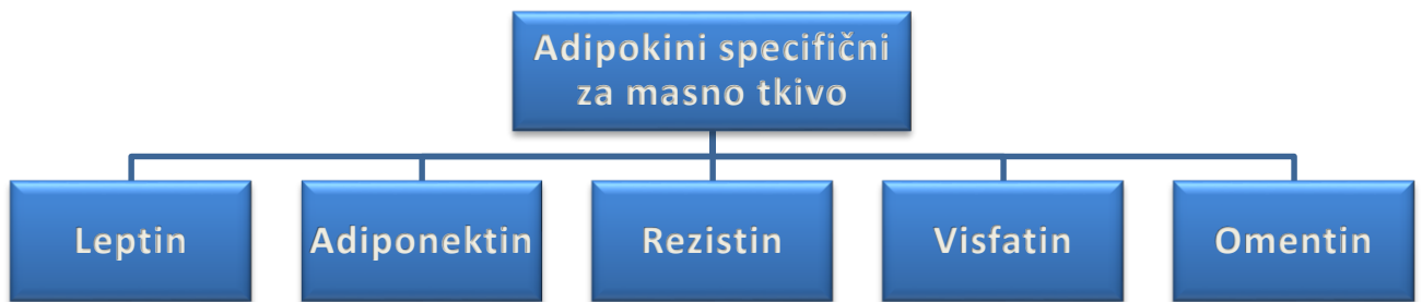
Slika 1. Adipokini specifični za masno tkivo

Leptin je hormon uključen u regulaciju uzimanja hrane, balansa energije i tjelesne mase te je iznimno bitan u regulaciji menstrualnog ciklusa, a ujedno je i prvi adipokin pomoću kojeg je otkrivena endokrina funkcija masnog tkiva. Razine leptina se povisuju nakon obroka dok se smanjuju prilikom gladovanja 19 . Dominantno se proizvodi u adipocitima i to ovisno o količini masnog tkiva, a nalazi se još u želucu, hipofizi, hipotalamusu, placenti i mliječnoj žlijezdi. Glavne uloge su održavanje metaboličke homeostaze i kontrola uzimanja hrane na način da djeluje na grupu neurotransmitera kao što su neuropeptid Y (NYP) i proopiomelanokortin (POMC), kao i na neurone koji luče kipeptin, dinorfin i bradikinin. (Slika 2.)