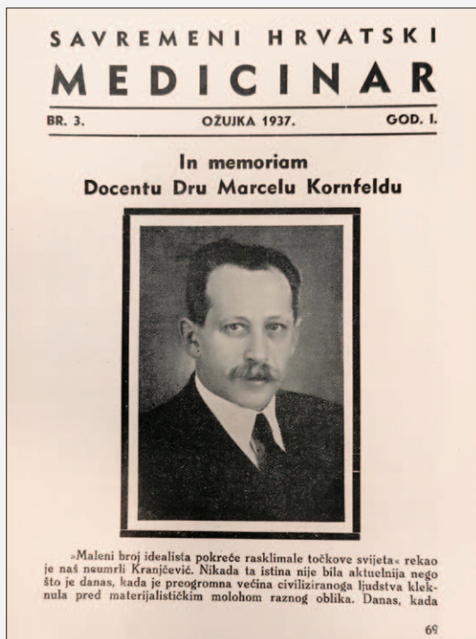
SLIKA 4. NASLOVNA STRANICA POSVEĆENA MARCELU KORNFELDU, SAVREMENI HRVATSKI MEDICINAR, GOD. 1 (1937), BR. 3, NACIONALNA I SVEUČILIŠNA KNJIŽNICA U ZAGREBU FIGURE 4. COVER PAGE DEDICATED TO MARCEL KORNFELD, SAVREMENI HRVATSKI MEDICINAR, VOL. 1 (1937), NO. 3, NATIONAL AND UNIVERSITY LIBRARY IN ZAGREB

dobili su pravo na beneficirani dodatak zbog posla koji rade (AMEF, br. 2864/1934). No, ta odredba nije uključila zaposlenike patoloških zavoda na fakultetima koji su najčešće radili i više obdukcija nego oni u bolnicama. Kornfeld je svoje zahtjeve opravdavao i time što je u čitavoj Kraljevini Jugoslaviji tada djelovalo samo šest patologa u dva fakultetska zavoda, tri u Beogradu i tri u Zagrebu. Zbog toga taj zahtjev nije predstavljao ni značajniji financijski izdatak. Njegova su nastojanja na kraju urodila plodom. Naime, u prosincu 1934. godine o tome je izrađena predstava koja je 1935. godine usvojena (AMEF, br. 1864/1934). Kornfeld je također bio aktivni član Zbora liječnika i Liječničke komore u kojoj je obnašao dužnost člana disciplinskog suda. 10