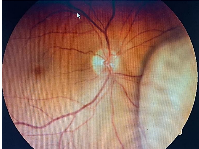
Slika 4. Kolor fotografija uvealnog melanoma