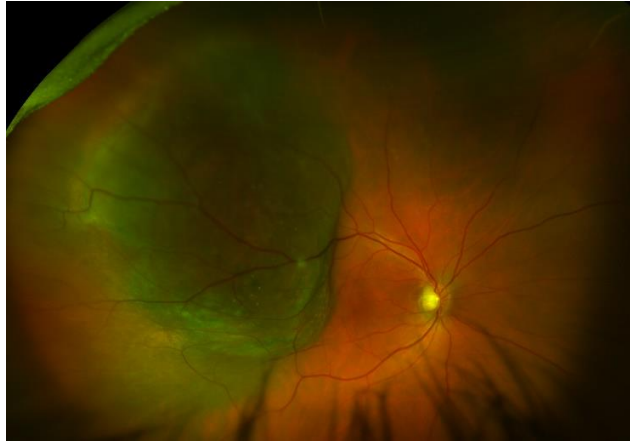
Slika 1. Kolor fotografija melanoma žilnice. Vidljiva subretinalna pigmentirana, solidna lezija sa zrcima narančastog pigmenta

Melanom cilijarnog tijela manje je čest te se javlja u 6% slučajeva.(32) Prezentira se kao nodularni oblik ili rjeđe kao oblik prstena. Ovisno o svojoj veličini, dugo može ostati neprepoznat i asimptomatski. Međutim, svojim rastom može uzrokovati dislokaciju leće s posljedičnim poremećajima refrakcije i akomodacije, kataraktom ili povišenim intraokularnim tlakom.(27) Navedene promjene dovode do oštećenja vida i kliničke dijagnoze. Često je povezan s proširenim episkleralnim (sentinelnim) žilama, ali samo rijetko s ekstraskleralnim širenjem.(32)