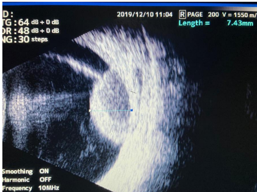
Slika 3. UZV melanoma žilnice, B-prikaz. Uz solidno odignutu mrežnicu vidljivo i serozno odignuće.

Ultrazvučna biomikroskopija (UBM) je varijacija ultrasonografije koja se koristi za snimanje i mjerenje tumora šarenice i cilijarnog tijela. Važna je za određivanje veličine i eventualnog ekstraokularnog širenja tumora cilijarnog tijela te za procjenu invazije melanoma šarenice u cilijarno tijelo.(44,45)