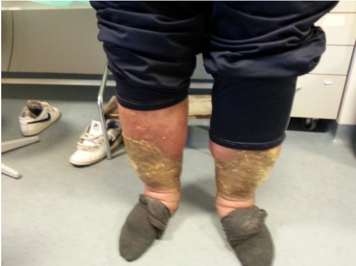
Slika 3. Aspergiloza kože nogu. Bolesnik s transplantiranim bubregom i elefantijazom nogu. Ljubaznošću doc.dr.sc. Nikoline Bašić-Jukić

Aspergiloza se može razviti i prije KT. Kronična plućna aspergiloza se, između ostalog, može prezentirati i kao aspergilom. Zbog naknadne imunosupresije i koinfekcija koje povećavaju rizik za razvoj IA preporuča se kirurško liječenje prije transplantacije (51).