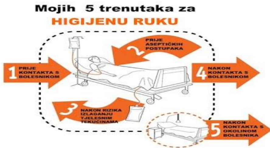
Slika 2. Mojih 5 trenutaka za pranje ruku