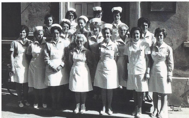
Slika 5. Odjelne sestre 1970. godine