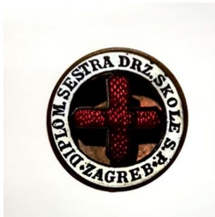
Slika 6. Broš diplomiranih sestara iz 1922. godine

Sastavni dio uniforme sestre bila je značka koja je sadržavala točno određene simbole i tekst koji je opisivao i potvrđivao status osobe koja ju nosi.