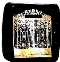
Slika 12. Broš prvostupnika sestrinstva Zdravstvenog veleučilišta

Broš se dodjeljivao medicinskim sestrama koje su završile Višu školu za medicinske sestre (1984.), tada je obrazovanje trajalo dvije godine. Broš je valovitog oblika te se na prednjoj strani nalazi uljanica i glava medicinske sestre s kpicom i natpis DIPLOMIRANA VIŠA MEDICINSKA SESTRA, ŠKOLE ZA MEDICINSKE SESTRE I TEHNIČARE MEDICINSKOG FAKULTETA U ZAGREBU. Dodjeljuje se do 1997. godine.