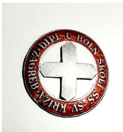
Slika 7. Broš bolničarki i redovnica

Broš se primjenjivao od 1922. godine, kada je završila i prva generacija sestara pomoćnica u Zagrebu. U prednjem dijelu broša nalazi se crveni križ koji okružuje natpis DIPLOM. SESTRA DRŽAVNE ŠKOLE S. P. ZAGREB. Broš je promjera 30 mm, a troškovi za izradu iznosili su 500 dinara.