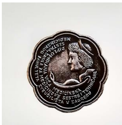
Slika 11. Broš diplomiranih viših sestara

Ovaj broš dobivale su sestre na temelju Pravilnika o nagrađivanju koji je donio Izvršni odbor Društva medicinskih sestara 1975. godine. Postoje dvije varijante ovog broša: srebrna i zlatna. U središtu broša nalazi se dlan ruke s križem za zapešću te plamenom iznad prstiju. Zlatni broš se dodjeljivao sestrama koje su se naročito zalagale za očuvanje zdravlja populacije i koje su bile prvi organizatori stručnih sekcija Društava sestara ili aktivno sudjelovale u izobrazbi sestara.