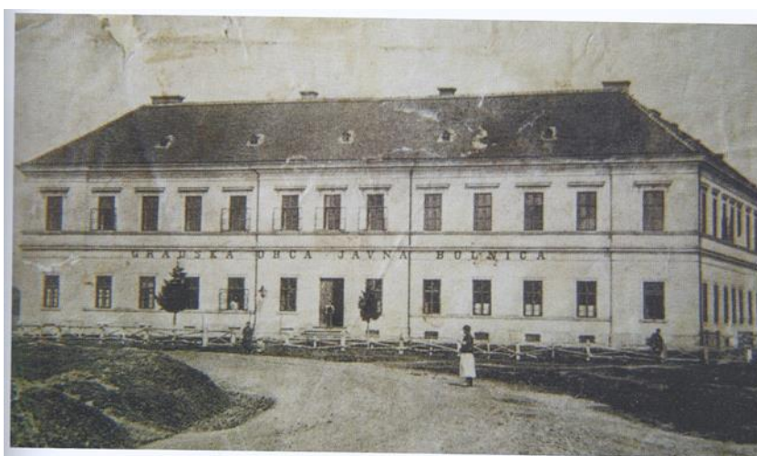
Slika 2. Novoizgrađena Gradska opća javna bolnica 1875.