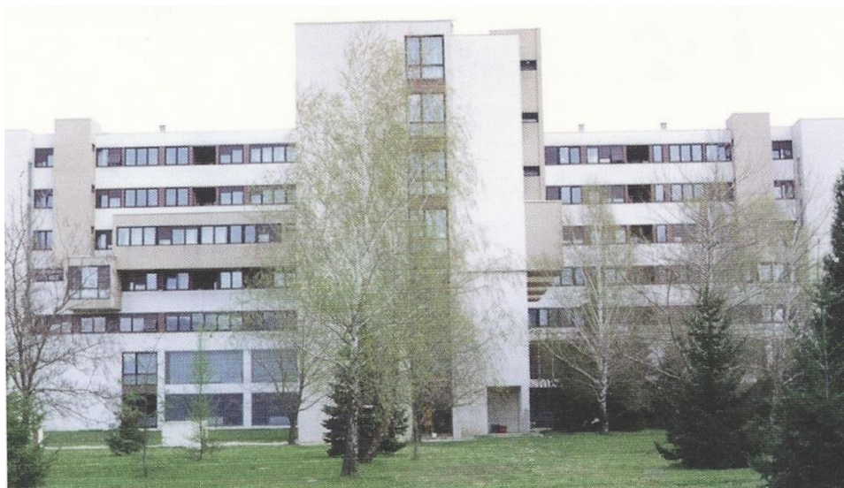
Slika 3. Bolnica nakon završetka izgradnje 1980.

Nova suvremena bolnička zgrada sagrađena je 1980. godine, a stare zgrade su obnovljene i uvedeni su novi, ažurni postupci u kurativnoj i preventivnoj medicini (8).