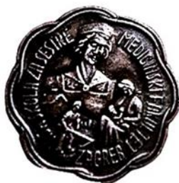
Slika 9. Broš Više škole za sestre

Škola za sestre pomoćnice 1945. godine mijenja naziv u Školu za medicinske sestre. Broš je u uporabi od 1945. godine, a do koje se godine koristi nije poznato. Po svojoj formi i strukturi sličan je brošu koji su dobivale sestre pomoćnice, jedino ima promijenjen natpis u DIPLOMIRANA SESTRA SR. HRVATSKE . Na poleđini nekih broševa ugraviran je broj. On predstavlja broj sestre (20).