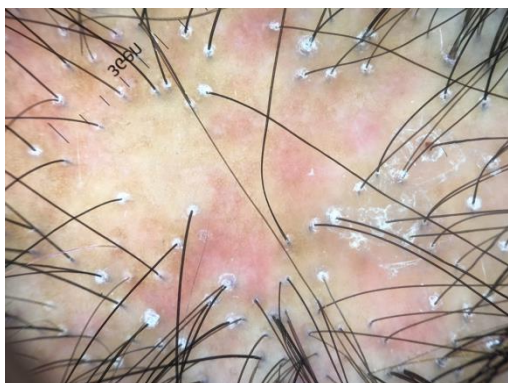
Slika 10. Trihoskopske značajke LPP. Snimljeno Handyscopom (Fotofinder Systems GmbH, Bad Birbach, Njemačka).

Najkarakterističniji, iako ne i patognomoničan trihoskopski znak za LPP, je perifolikularna hiperkeratoza koja se najbolje uočava tzv „suhom“ dermatoskopijom (dermatoskopija bez primjene gel ili tekućeg sredstva) (123). Ljuske se penju duž stabljike vlasi i rade cjevastu strukturu koja prekriva proksimalni dio dlake. Ova struktura se naziva „cjevasta“ struktura ili struktura „poput ovratnika“ (engl. hair casts) (123,125). Stabljika dlake može biti obuhvaćena s hiperkeratotičnom strukturom duljine nekoliko milimetara iznad površine kože. Ovaj simptom se uočava u različitim bolestima vlasišta koje uključuju SD, psorijazu, pedikulozu i monoklonalnu gamapatiju. Vjeruje se da je ova struktura posljedica promjena u vanjskoj ovojnici dlake koja rezultira značajnom perifolikularnom deskvamacijom. Okrugla, perifolikularna plavkasto-sivkasta ili lividna područja koja okružuju prazne folikularne otvore se opisuju u osoba s tipom kože Fitzpatrick IV, V, i VI (124). Ova struktura histološki vjerojatno korelira sa subepidermalnim melaninom u folikulu dlake koji je ušao u katagenu fazu ciklusa prije potpunog nestanka i stvaranja ožiljnog tkiva.