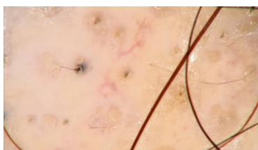
Slika 2. Crne točke. Snimljeno videodermatoskopom (Fotofinder Systems GmbH, Bad Birbach, Njemačka). Arhiva Klinike za kožne i spolne bolesti KBC Sestre milosrdnice.

Otvori folikula dlake se trihoskopski vide kao male ovalne strukture poput točke. Crne točke predstavljaju ostatke pigmentiranih dlaka koje su slomljene ili uništene u razini površine kože (Slika 2). Vidimo ih u 11 % bolesnika s nekim oblikom alopecije, u više od 50 % bolesnika u akutnoj fazi AA, u 100 % bolesnika s PCSA i kod više od 40 % bolesnika s anagenom alopecijom uzrokovanom kemoterapijom (112). Nisu vidljive kod androgenetske alopecije (eng. androgenetic alopecia (AGA) i telogenog efluvija (112).