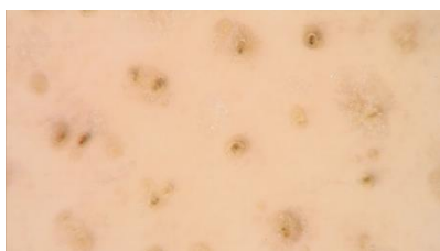
Slika 3. Žute točke. Snimljeno videodermatoskopom (Fotofinder Systems GmbH, Bad Birbach, Njemačka).

točke se vide u više od 60 % bolesnika s AA-om i znak su visoko aktivne bolesti te upućuju na lošiju prognozu (Slika 3). Na velikom povećanju kod bolesnika s AA-om se vidi dvostruki rub (Slika 4). U bolesnika s DLE-om folikularni otvori su ispunjeni keratinskim čepovima i nešto su manje i nepravilnije raspoređeni nego kod AA-a (Slika 5). Osim kod AA-a i DLE-a, mogu biti prisutne i kod bolesnika s PCSA te kod AGA-a i telogenog efluvija. Žute točke u bolesnika s telogenim efluvijem i AGA-om imaju tipičan uljni (sebacealni) izgled (113).