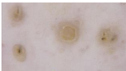
Slika 4. Žute točke – dvostruki rub. Snimljeno videodermatoskopom (Fotofinder Systems GmbH, Bad Birbach, Njemačka).