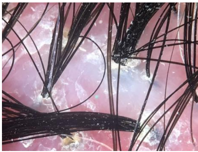
Slika 12. Trihoscopske značajke politrihije i zvjezdolikog uzorka kod FD. Snimljeno videodermatoskopom (Fotofinder Systems GmbH, Bad Birbach, Njemačka).