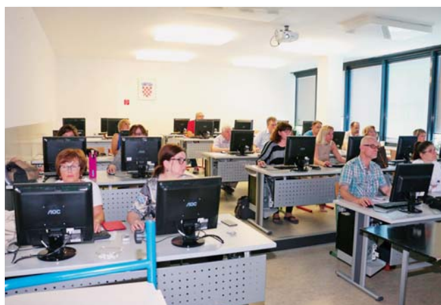
Sudionici jedne od 33 održane LMS-radionice

podijeljenih uloga predavača i studenata, te u predavanja uvrstiti interaktivnost, dramaturške elemente, povratnu informaciju, stanke za razmišljanje i slično. Takav stav nerijetko znaju podržavati i studenti koji su još uvijek nespremni za kritiku na licu mjesta. Na taj se način stječe lažni dojam kako je klasično predavanje važno za povećanje kvalitete znanja i studija. Kad bi to zaista bilo točno, tada se ne bi učestalo događalo da nam dvorane zjape poluprazne na predavanjima u kojima se studenti ne prozivaju ili zapisuju. Prema tome danas je sasvim jasno da klasična predavanja, za koja svakako treba reći da imaju i trebaju imati svoje mjesto u podučavanju, mogu pružiti prostor za razdvajanje bitnog od nebitnog, a prilikom dobre pripreme studenata mogu privući i više pažnje, ipak teško da mogu zadovoljiti različite stilove učenja studenata koji se pokazuju ključnim za efikasnije i brže učenje, bolje razumijevanje i lakše usvajanje znanja.