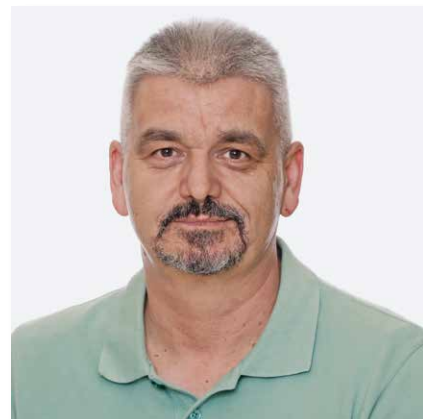
Prof. dr. sc. Mirza Žižak

Prvih devet tjedana online nastave u ovoj akademskoj godini pokazuje kako se LMS koristi daleko intenzivnije nego što je to bio slučaj s online nastavom koja se provodila potkraj prošle akademske godine. Tome u prilog najbolje govore brojke koje pokazuju posjećenost pojedinih predmeta na MEF-LMS-u tijekom prvih devet tjedana nastave ove akademske godine u odnosu na 14 tjedana nastave u prošloj akademskoj godini. U ovoj je akademskoj godini ukupna posjećenost LMS-a već sada, nakon samo devet tjedana nastave, gotovo dosegla posjećenost LMS-a u promatranom razdoblju tijekom prošlogodišnje online nastave. S obzirom na sadašnju posjećenost predmeta u LMS-u kao i činjenice da uskoro s nastavom započnu i predmeti koji su prošle godine bili među deset najaktivnijih predmeta u LMS-u, jasno je da će sljedećih pet tjedana posjećenost LMS-a rasti, što će i biti razlogom znatno veće posjećenosti u odnosu na onu zabilježenu u istom vremenskom razdoblju tijekom prošle akademske godine. Posjećenost je ujedno i dobar indikator aktivnosti predmeta unutar LMS-a. Podsjećam da je prošlogodišnja analiza pokazala dobru povezanost između interaktivnih sadržaja i posjećenosti pojedinog predmeta, prema kojoj posjećenost raste s brojem postavljenih testova i foruma.