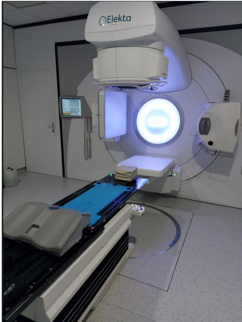
Slika 2: Linearni akcelerator koji se koristi za zračenje pacijenata s karcinomom nazofarinksa radioterapijom snopovima promijenjivog intenziteta. Klinika za onkologiju, KBC Zagreb.

kod liječenja radioterapija najčešće kombinira s kemoterapijom (3). Na slici 2 prikazan je linearni akcelerator koji se koristi za radioterapiju pacijenata s karcinomom nazofarinksa.