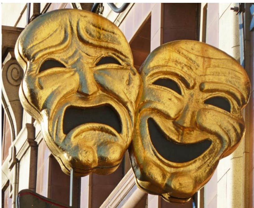
Slika 1. Maske komedije i tragedije korištene u kazalištu

Ličnost obuhvaća trajne obrasce misli, ponašanja i emocija koje definiraju pojedinca. Ona utječe na ljudsku percepciju, interakcije i nošenje sa situacijama. Kada ta ličnost odstupa u obliku devijacije od društvenih normi, uzrokuje distres i oštećenje, tada govorimo o poremećajima ličnosti. Poremećaji ličnosti uključuju neprilagođene obrasce razmišljanja, osjećanja te ponašanja. Njihova dijagnostička kompleksnost može biti vrlo izazovna radi komorbiditeta i preklapajućih simptoma s normalnim varijacijama. U doba globalizacije, brzog tehnološkog napretka te ekstremne kompetitivnosti, na znanosti ostaje da uđe u srž problema te istraži porijeklo poremećaja ličnosti i sve ostale mogućnosti koje nam se nude u potencijalnoj modifikaciji puta, kojim smo kao društvo krenuli. Prethodna rješenja i saznanja više ne samo da nam nisu dovoljna, nego za sobom vuku novi set problema. Psihijatrija se kao struka našla na vrlo važnoj prekretnici, u kojoj sve više ljudi primjećuje njezin značaj u očuvanju ljudskog zdravlja i koliku društvenu ulogu zauzima u današnjem svijetu. Slika 1. prikazuje maske komedije i tragedije korištene u kazalištu kako bi pomogle glumcima prikazati emocije na isti način, na koji ljudi u društvu nose maske radi prikaza društveno prihvatljivih emocija (1).