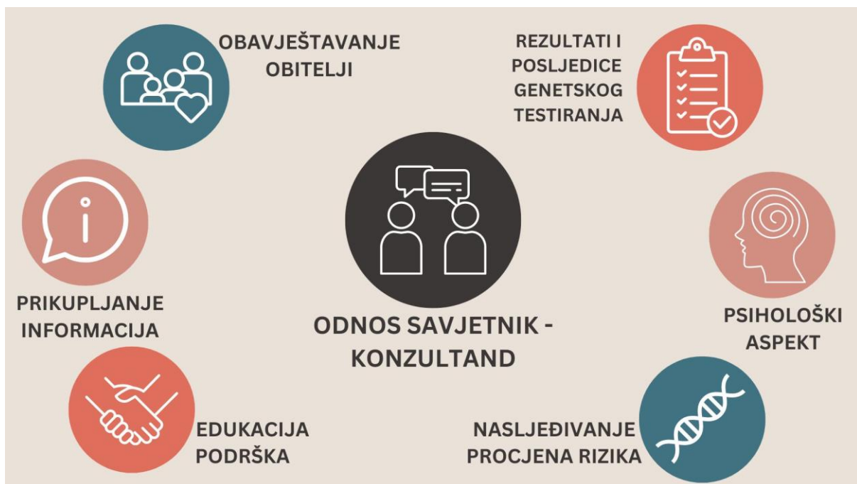
Slika 1. Komponente genetskog savjetovanja. Autorsko djelo

Još jedan bitan aspekt genetskog savjetovanja je korištenje nedirektivnog pristupa. Način prenošenja informacija može utjecati na odluke pacijenata. Na savjetniku je da sve informacije i odgovore na pitanja pruži na objektivan način, bez sugestija, te da ih prenese u okruženju podrške kako bi odluka koju donosi pacijent bila autonomna, donesena samostalno bez pritiska i stresa (45).