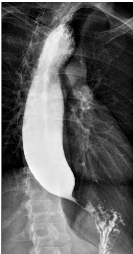
Slika 3. Niknejad M. Znak ptičjeg kljuna u ahalaziji (bird-beak-sign-achalasia)

mogu dovesti do regurgitacije i aspiracije što uzrokuje ponavljajuće aspiracijske pneumonije. U liječenju ne postoje kurativne opcije pa se pribjegava opcijama koje mogu sačuvati funkciju jednjaka. Od lijekova se koriste nitrati, blokatori kalcijevih kanala i botulinum toksin. Unatoč tome, u većini je slučajeva potrebna kirurška intervencija (35,38).