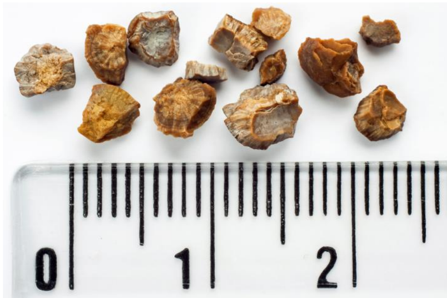
Slika 2. Usporedba veličine ekstrahiranih kamenaca, Preuzeto s Renal & Urology News https://www.renalandurologynews.com/home/news/urology/kidney-stones/stone-treatment-in-kidney-grafts-characterized/ (16)

ESWL se često koristi kod bubrežnih kamenaca velikih do 2 cm u promjeru (Slika 2) kada su kamenci smješteni u bubrežnoj nakapnici, gornjim i srednjim bubrežnim čašicama. U ovakvim slučajevima, može se ostvariti stopa uspjeha liječenja od 80 do 100%, no često je potrebno ponoviti postupak nekoliko puta. Postotak komplikacija iznosi do 20%. Za kamence u donjem polu bubrega rezultati su lošiji, pogotovo ukoliko su prisutni otežavajući faktori kao što su kamenci rezistentni na udarne valove (kalcijev oksalat monohidrat, kalcijev fosfat i cistin), oštar kut između infundibuluma i nakapnice, dugi donji pol (>10 mm) i uski infundibulum (<5 mm). Ovakve kamence, ukoliko postoji indikacija, bolje je rješavati endourološkim metodama. ESWL se može primjenjivati i za kamence u mokraćovodu. Stope uspjeha liječenja kamenaca u mokraćovodu su od 85 do 100%. Međutim, za veće kamence smještene distalno prednost se daje endourološkom pristupu. (15)