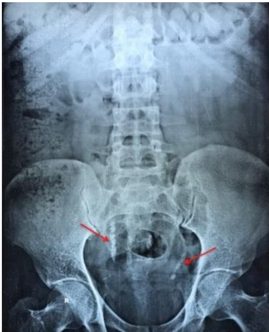
Slika 5. RTG snimka steinstrassea bilateralno u oba mokraćovoda. Preuzeto iz Garg G, Pandey S, Agarwal S, Sankhwar S. Unusual cause of obstructive uropathy: bilateral steinstrasse. BMJ Case Rep. (26)