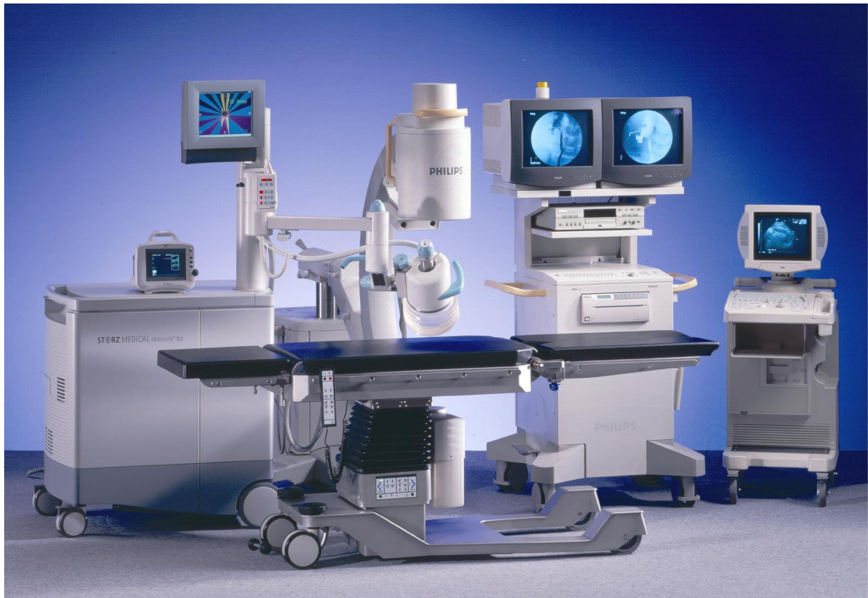
Slika 1. Moderni litotriptor s dijaskopijom i ultrazvukom (14)

treba ispuniti velik broj zahtjeva: radiotransluentnu radnu površinu, visoku nosivost, maksimalnu pristupačnost, mogućnost postavljanja u izocentrične Tredelenburg i anti-Tredelenburg položaje, udobnu najnižu poziciju i mnoge druge. (13)