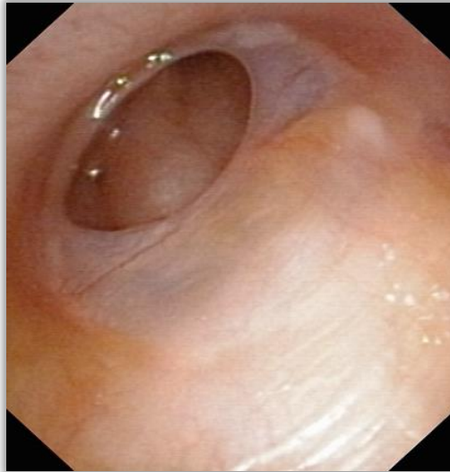
Slika 7. Veći defekt lijevog bubnjića sprijeda dolje.