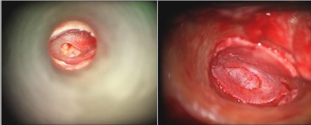
Slika 12. Subfibrozna („underlay“) tehnika.

liječenje malih perforacija koje se mogu dobro vizualizirati. Ne pojavljuju se prethodno navedene nuspojave kao što su oticanje i lateralizacija presatka. Međutim, dolazi do redukcije prostora srednjeg uha i mogu se razviti priraslice. Vaskularizacija presatka lošija je nego u ektrafibroznoj tehnici pa je i veći rizik za neuspjeh operacije. Također, ovo nije tehnika izbora kod anteriornih perforacija zbog loše vizualizacije tog dijela bubnjića. [43]