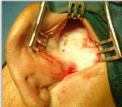
Slika 9. Fascija temporalnog mišića iz retroaurikularnog pristupa.

Kao presatci, u navedenim zahvatima mogu se koristiti razna tkiva. Fascija temporalnog mišića jedan je od mogućih izbora, a zbog svoje fleksibilnosti jednostavna je za korištenje, ali s druge strane to ju čini podložnijom retrakciji u slučaju komplikacija i kroničnih promjena (Slika 9.). Perihondrij je često korišteno tkivo u timpanoplastici (Slika 10., Slika 11.). Može se koristiti za reparaciju cijelog ili dijela bubnjića, a zbog veće čvrstoće daje dobru stabilnost. Jedan od mogućih izbora je i hrskavica koja se zbog svoje čvrstoće i konzistencije pokazala dosta otpornom pri komplikacijama kao što su infekcije i devaskularizacija. Najčešće se uzima iz ušne školjke ili tragusa. Hrkavica može biti postavljena u jednom komadu ili u više fragmenata takozvanom palisadnom tehnikom. Kao presadci nekada se koriste i vezivno-adipozni transplantati. Presatci periosta, primjerice iz mastoidnog nastavka, za sada nisu u rutinskoj praksi jer su se pojavile nuspojave kao što je sekundarno okoštavanje, ali potencijal periosta kao presatka još se uvijek istražuje. [34]