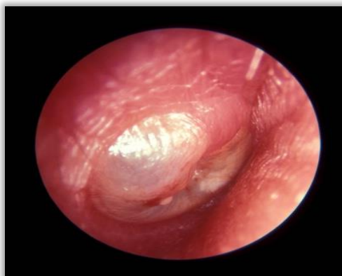
Slika 4. Gnojna ili purulentna akutna upala uha. (uz dopuštenje: doc.dr.sc. Kovač Bilić L.)

Infekcija gornjeg dijela respiratornog sustava najčešći je uzrok akutne bakterijske upale srednjeg uha u djece. Uzročnici bakterijskih upala gotovo uvijek su kolonizatori nazofarinksa, a najčešće izolirani su S. pneumoniae , H. influenzae i M. catarrhalis . Virusi također mogu uzrokovati upalu srednjeg uha, ili češće, uzrokuju upalu gornjeg respiratornog trakta koju prati bakterijska superinfekcija. Kod djece, virusni uzročnici akutne upale su adenovirusi, RSV (respiratorni sincicijski virus), gripa, parainfluenza, enterovirusi, rinovirusi i koronavirusi. Karakteristično za akutne upale bilo kojeg organskog sustava, akutna upala srednjeg uha manifestira se općim i lokalnim simptomima. Što se tiče općih simptoma, bolesnik se prezentira općom slabošću, letargijom, povišenom tjelesnom temperaturom, glavoboljom i sličnim simptomima. Lokalno je prisutna bolnost u području uha, sekrecija u slučaju perforacije i slabljenje sluha. [21] Za postavljanje dijagnoze, osim kliničke prezentacije, ključan je otoskopski pregled. Tipičan otoskopski nalaz je hiperemija i ispupčenje bubnjića, moguća je pojava perforacije bubnjića te sekrecija upalnog eksudata iz srednjeg uha (Slika 4.). Nekada ovi znakovi nisu prisutni kod akutne upale uha, ali otoskopski nalaz koji obuhvaća promjene kao što su odsutnost svjetlosnog refleksa, zadebljanja i zamućenja bubnjića također govore u prilog akutnoj upali (Slika 5.). [22]