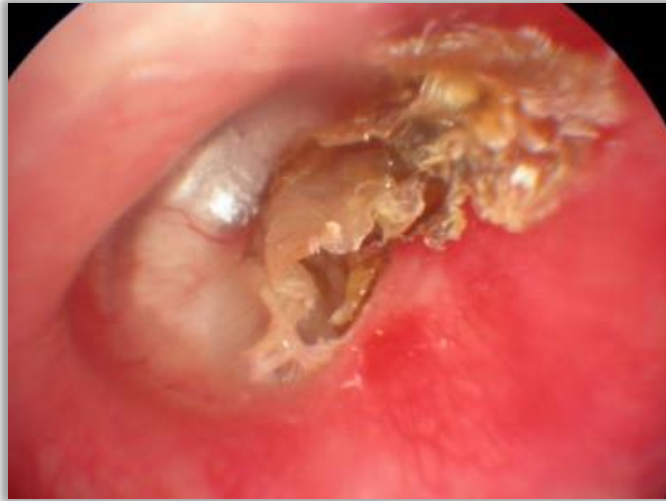
Slika 6. Kolestatom.