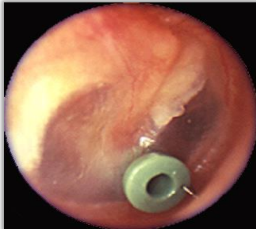
Slika 3. Ventilacijska cjevčica u prednjem kvadrantu desnog uha.