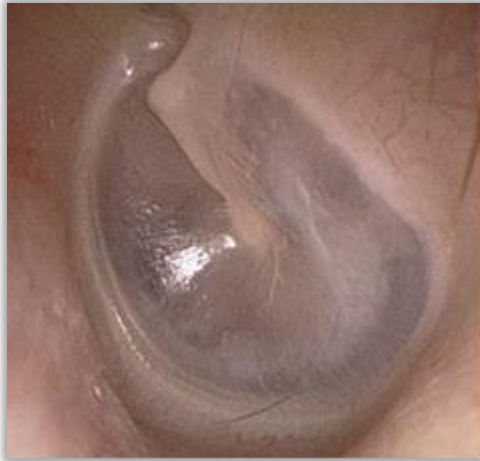
Slika 1. Uredan otoskopski nalaz.

Vanjsko uho svojom anatomskom građom omogućuje širenje zvuka-tlačnog vala kroz zvukovod prema bubnjiću. Zvučni val dovodi do titranja bubnjića koje se zatim nastavlja preko triju koščica srednjeg uha sve do fenestre ovalis, otvora na pužnici. Prolaskom zvuka kroz navedeni put vanjskog i srednjeg uha do fenestre ovalis koja je spoj sa unutarnjim uhom dolazi do amplifikacije signala prvenstveno zbog odnosa površina bubnjića i fenestre ovalis koji iznosi 1:18, a dijelom i zbog anatomskog odnosa triju slušnih koščica. [14]