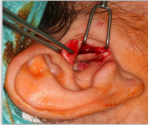
Slika 10. Incizija tragusa radi uzimanja presatka perihondrija.