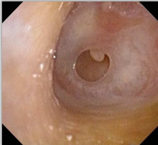
Slika 8. Defekt bubnjića kroz koji prominira vršak drške čekića.

Autori S. Cayir i H. Mutlu u svojoj su studiji proučavali traumatske perforacije bubnjića, a podijelili su ih u tri skupine ovisno o površini perforacije. Malim perforacijama smatrale su se one koje su uključivale \leq 25\% površine bubnjića, srednjim one koje su bile 25% - 50% veličine bubnjića, a velike perforacije bile su one sa zahvaćanjem preko 50% površine. [19] Također, prijeoperativno otoskopski uočene upalne promjene bubnjića prema nekim autorima povezane su s lošijim ishodom. Uzrok perforacije ne utječe na izbor kirurškog pristupa, ali može utjecati na odabir vrste presatka. Pregled kontralateralnog uha pomaže u procjeni ozbiljnosti perforacije zahvaćenog uha i prohodnosti Eustahijevih cijevi. Prema nekim