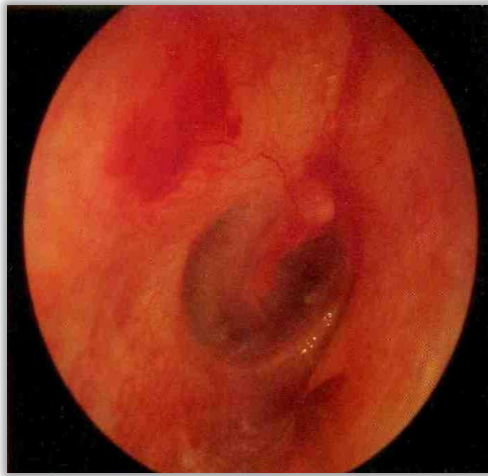
Slika 5. Kongestivna ili kataralna akutna upala uha.

Temelj liječenja akutne upale srednjeg uha je simptomatsko liječenje, primjerice analgetici, antipiretici za ublažavanje općih simptoma, fiziološka otopina za ispiranje, zatim dekongestivi za održavanje prohodnosti Eustahijeve cijevi i ventilacije srednjeg uha, a primjeni antibiotika treba pristupiti racionalno. [23, 24] U većine bolesnika do rezolucije upale dolazi spontano, bez primjene antibiotske terapije. Antibiotska terapija potrebna je ukoliko je došlo do perforacije i prisutna je otoreja, kod obostranog otitisa u djece mlađe od dvije godine, kod lošeg općeg stanja djeteta, u slučaju postojanja komorbiditeta koji bi mogli pogoršati tijek bolesti, kada nema poboljšanja u kliničkoj slici nakon tri dana ili ako tijekom prva tri dana dođe do pogoršanja. Prvi izbor u antibiotskom liječenju je amoksisicilin koji se daje u dozi od 90 mg/kg tjelesne mase podijeljeno u tri doze na dan, 7 dana. [25] Perforacija, kao drugi stadij akutne upale uha, najčešće cijeli spontano nakon rezolucije upale. Kako akutna upala ne bi prešla u kroničnu te kako bi perforacija zarasla nakon upale, potrebno je na vrijeme prepoznati akutnu upalu i liječiti je, a prema smjernicama ako je potrebno i antibiotskom terapijom. [26]