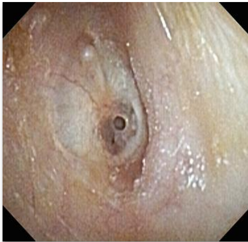
Slika 2. Defekt zaostao nakon vađenja ventilacijske cjevčice u desnom uhu.

Perforacija bubnjića jedna je od komplikacija postavljanja ventilacijske cjevčice u bubnjić (Slika 2.). Cjevčica se postavlja kod djece s učestalim upalama srednjeg uha koje ne odgovaraju na liječenje kako bi se evakuirao sadržaj srednjeg uha (Slika 3.). [17] Nakon uklanjanja cjevčice, bubnjić zacijeli kod većine bolesnika, ali kod nekih perzistira perforacija bubnjića. Na otežano cijeljenje bubnjića utječe više faktora, a neki od njih su dob starija od 10 godina, veće perforacije, timpanoskleroza i duže vrijeme stajanja cjevčica u bubnjiću. [18]