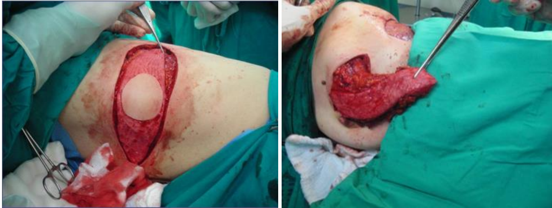
Slika 3. Upotreba režnja m. latissimus dorsi za rekonstrukciju nakon SNSM ili SSM