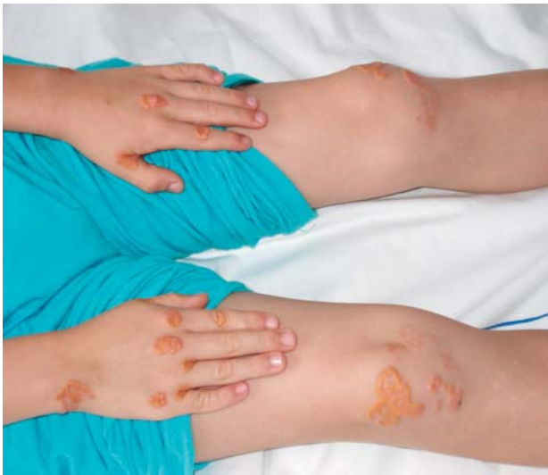
Slika 1. Ksantomi u bolesnika s porodičnom hiperkolesterolemijom Figure 1. Xanthomata in a patient with familial hypercholesterolemia