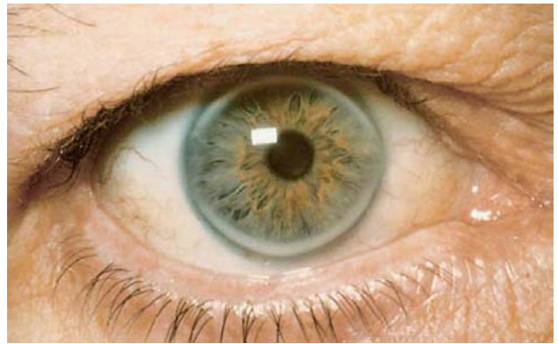
Slika 3. Arcus corneae u bolesnika s porodičnom hiperkolesterolemijom Figure 3. Corneal arch in a patient with familial hypercholesterolemia

svrstava među češće nasljedne genske metaboličke poremećaje. 6 Procjenjujemo da je u Hrvatskoj 8000–9000 bolesnika s ovom bolesti, većina ih je neprepoznata i stoga neliječena te imaju velik rizik od ranog razvitka kardiovaskularnih bolesti i smrti. 7 Najčešći uzrok bolesti je mutacija na genu za receptor lipoproteina niske gustoće (LDL – low density lipoprotein ) koji se nalazi na 19. kromosomu i dugačak je 45 kb, a čini ga 17 eksona. 8 Do sada je, prema registru prijavljenih mutacija pri Centru za kardiovaskularnu genetiku, UCL, London, Ujedinjeno Kraljevstvo, opisano oko 1100 mutacija. 9 Zbog navedene mutacije dolazi do funkcijske pogreške LDL-receptora zbog čega LDL-čestice bogate kolesterolom ne mogu biti unesene i razgrađene u stanicama, poglavito jetre. Posljedično one se nagomilavaju u krvi te dolazi do povećanja količine ukupnog i LDL-kolesterola.