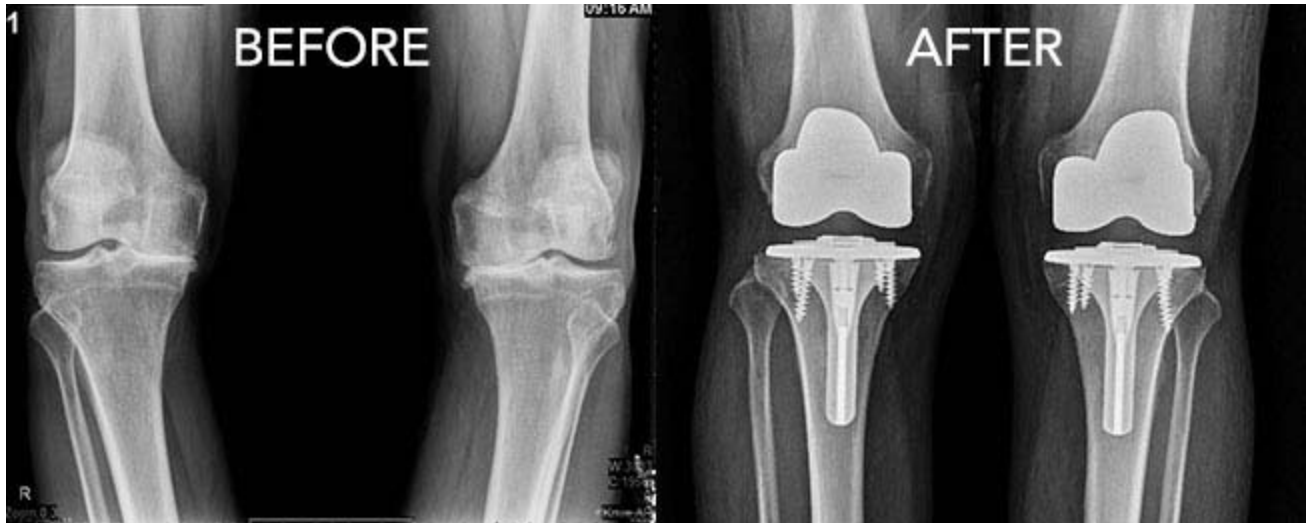
Slika 5. Radiografski prikaz koljena u AP projekciji (lijevo) preoperativno, (desno) nakon TKR operacije