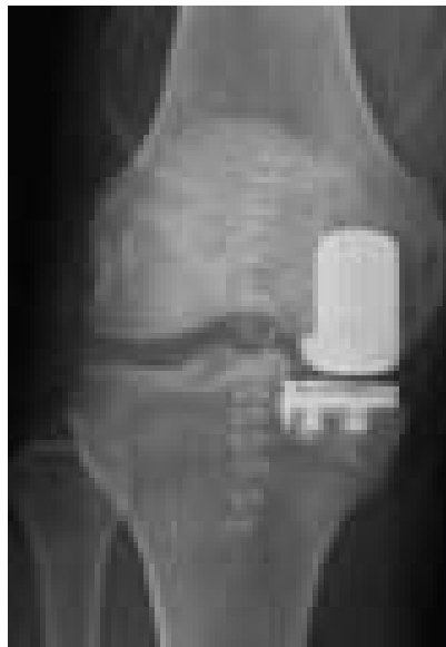
Slika 4. Postoperativna rendgenska snimka densnog koljena u AP projekciji. Ugrađena medijalna unikompartamentalna endoproteza koljena PREMA: httpwww.drpaullux.compatient-informationeducationknee-replacement.php