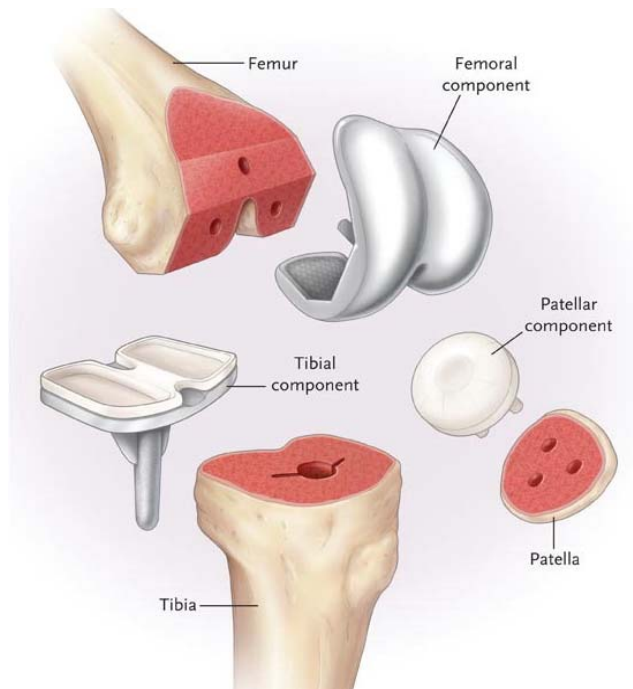
Slika 6. Komponente za ugradnju kod TKR. Operativno obrađeni vrhovi kosti na koje se ugrađuju komponente endoproteze

PREMA: http://orthoinfo.aaos.org/topic.cfm?topic=a00221