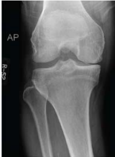
Slika 3. Rendgenska snimka densnog koljena u AP projekciji. Prikaz artrotskih promjena medijalnog kompartmenta koljena snimljena preoperativno