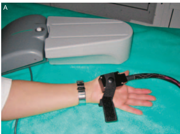
Figure 3. Objectivization of sensory disorder in a patient with CRPS type 2 after peripheral nerve trauma. Method – quantitative sensory testing