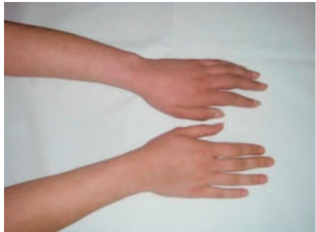
Slika 2. Kronični stadij CRPS-a tipa II lijeve ruke. Promijenjena vazomotorika, snižena temperatura, manja bol i bolja funkcija