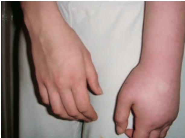
Slika 1. Akutni stadij CRPS-a tipa I lijeve ruke. Izraženi autonomni simptomi, edem, bol i potpuni manjak funkcije