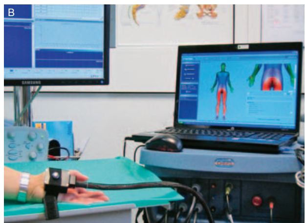
Slika 4. (A i B) Kvantitativno osjetno testiranje za vrijeme ispitivanja praga osjeta za toplo i hladno, odnosno analizu funkcije A-delta i C-vlakana perifernih živaca: prikaz dijagnostičke procedure