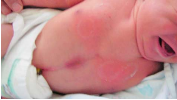
Slika 1. Bolesnik s rascjepom prsne kosti Figure 1. Patient with sternal cleft