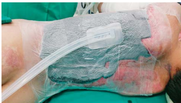
Slika 2. Sistem negativnog tlaka kao fiksacija nakon presađivanja kože djelomične debljine

Figure 1. Four days after the application of topical negative pressure therapy over hypertrophic granulating tissue (over the area of full thickness burn wound that was treated conservatively) there is a marked improvement in the vascularity of the wound bed and the wound is clinically cleaner