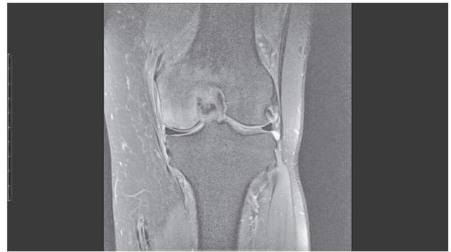
SLIKA 1. MAGNETSKA REZONANCA LIJEVOG KOLJENA (KORONARNI PRESJEK, FAT-SATURATED PROTON-DENSITY WEIGHTED SEKVENCA) NA KOJOJ SE VIDI EDEM KOŠTANE SRŽI I INFRAKCIJA SUBHONDRALE KOSTI MEDIJALNOG KONDILA FEMURA, ŠTO UPUĆUJE NA SPONTANU OSTEONEKROZU KOLJENA

Nakon kliničkog pregleda uvijek valja načiniti standardnu radiološku obradu koljena. 4,40 Dok u početnom stadiju SONK-a najčešće nema nikakvih znakova oštećenja, u kasnijim se stadijima javljaju karakteri-