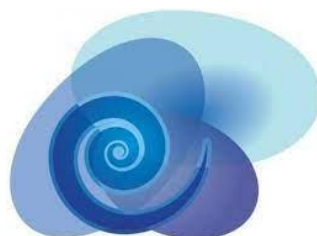
Slika 4. HZJZ. Logo Nacionalnog programa ranog otkrivanja raka debelog crijeva Republike Hrvatske [slika s interneta]. [13.5.2023.]. Dostupno na: https://www.hzjz.hr/sluzba-epidemiologija-prevencija-nezaraznih-bolesti/nacionalni-program-ranog-otkrivanja-raka/

Rak debelog crijeva (kolorektalni karcinom) treće je po redu sijelo raka u svijetu, nakon raka dojke i raka pluća. Prema procjenama Svjetske zdravstvene organizacije, godišnje od njega oboli oko 2 milijuna osoba, a umre 0,95 milijuna (27). Većina bolesnika starija je od 50 godina ako se bilježi značajan porast obolijevanja mlađih osoba. Nacionalni program ranog otkrivanja raka započeo je 2008. godine. Ciljana skupina u programu su žene i muškarci od 50 do 74 godina starosti. Potrebno je da su u periodu od tri godine obuhvaćeni Programom ili imaju uobičajen rizik za nastanak raka (28). Ožujak je, prema mnogim europskim i svjetskim zemljama, posvećen borbi protiv raka debelog crijeva.