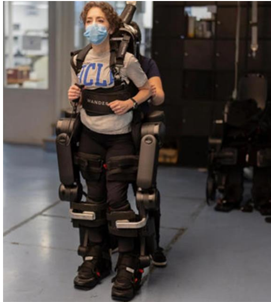
Slika 4. Egzoskelet u rehabilitaciji neurološkog pacijenta

Dostupno na: https://ustoday.news/fda-approves-wandercraft-exoskeleton-for-stroke-rehabilitation/