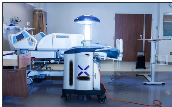
Slika 6. Dezinfekcija bolničkog inventara UVC robotom

Dostupno na: https://healthmanagement.org/c/icu/post/the-importance-of-reliable-reprocessing-of-hospital-beds