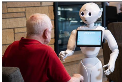
Slika 3. Robot Pepper

Popularni humanoidni robot, Pepper programiran je za uključivanje i praćenje starijih osoba u terapijskim aktivnostima u interaktivnoj komunikaciji. Rezultati provedenih studija pokazali su da on može uspješno osigurati učinkovitu komunikaciju i za pacijente s mentalnim problemima i za one koji su zdravi. (34)