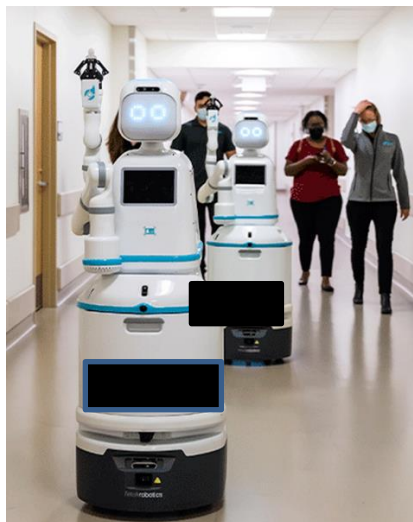
Slika 2. Moxie robot

Udruženju voditelja medicinskih sestara u Kaliforniji 2022., Jean Watson je rekla: „Nema ništa loše u tehnologiji, ali ako nemamo način razmišljanja da održimo komunikaciju između ljudi, izgubili smo put i nismo ispunili razlog zašto smo ovdje.“ Suradnja pacijenta, osoblja i robota u bolničkoj sredini zasniva se povjerenju zdravstvenih djelatnika i pacijenata. Nova robotska tehnologija temelji se na svojoj značajnoj praktičnosti. (30).