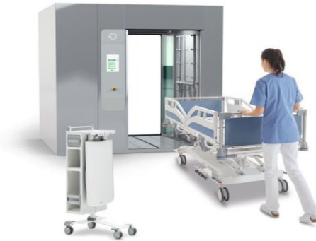
Slika 5. Automatizirana dezinfekcija bolničkog inventara

Primjenom robotskih sustava UV-C smanjuje se izloženost osoblja multirezistentnim bakterijama i preveniraju reinfekcije u prostorijama već nakon 10 minuta izlaganja bolničkog inventara u bolesničkoj sobi i deaktivira 99,99% bakterija što potvrđuju naknadni brisevi. (50)