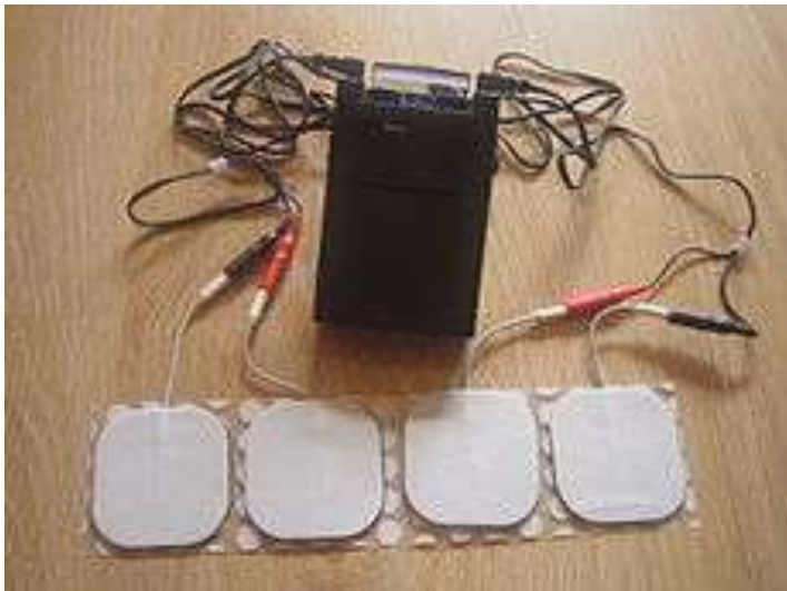
Slika 4. TENS aparat. Prema: Wikipedia contributors. Transcutaneous electrical nerve stimulation. Wikipedia, The Free Encyclopedia (2014)

Transkutana električna živčana stimulacija (TENS) (Slika 4.) terapijski je postupak primjene kontrolirane, niskovoltazne električne stimulacije za podraživanje živčanog sustava preko kože sa svrhom izazivanja analgetičkog učinka. Stvarno djelovanje metode još je uvijek nedovoljno poznato, pa je i nadalje predmet istraživanja. Postoji nekoliko teorija o djelovanju TENS-a od kojih je najpoznatija teorija nadzora ulaza percepcije boli, po kojoj podraživanje debljih A-alfa i A-beta vlakana facilitira presinaptičku inhibiciju malih interneurona u kralježničnoj moždini, čime se blokira prijenos boli do transmisijskih stanica (Ćurković i sur. 2004). Studije pokazuju da TENS ima blagi analgetski učinak kod OA kuka i koljena (Osiri et al. 2000). Prednosti TENS-a su jednostavnost, neinvazivnost i sigurnost primjene, te mogućnost samostalne primjene, stoga je preporučan u NICE i OARSI smjernicama. (Zhang et al. 2008, NICE 2014.)