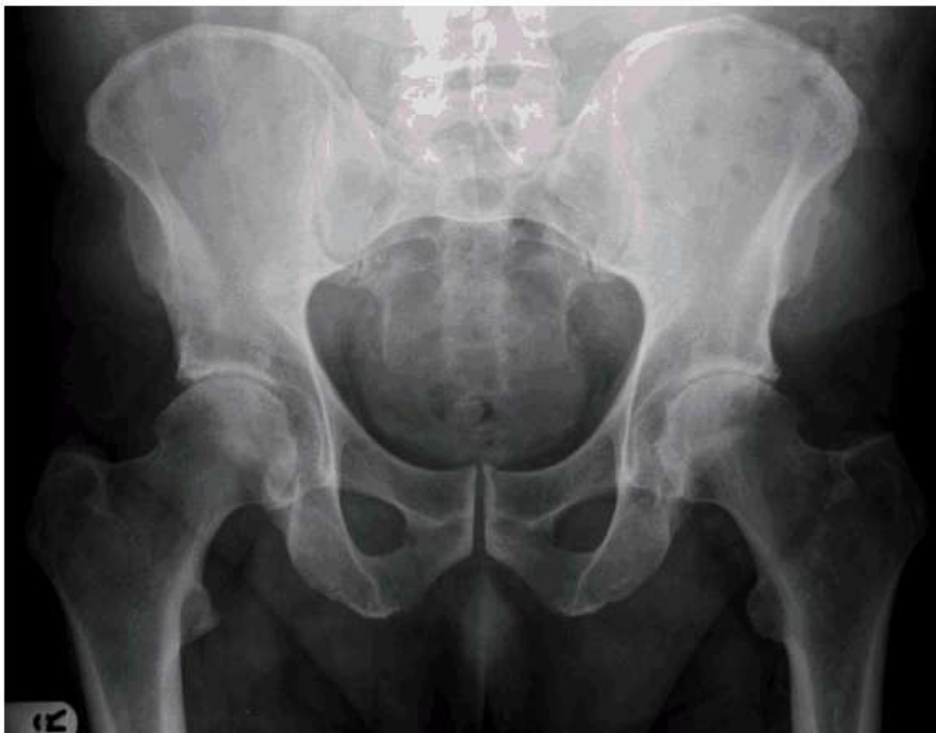
Slika 2. Bilateralni osteoarthritis kuka uz stanjenje zglobnog prostora i subhondralnu sklerozu. Prema Hing et al. (2012)