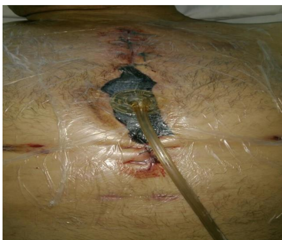
Sl. 12. Drugo postavljanje TNT

Slika 6-12. Aplikacija TNT na sternalnu ranu