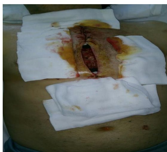
Sl. 11. Obrada rane nakon prve promjene TNT