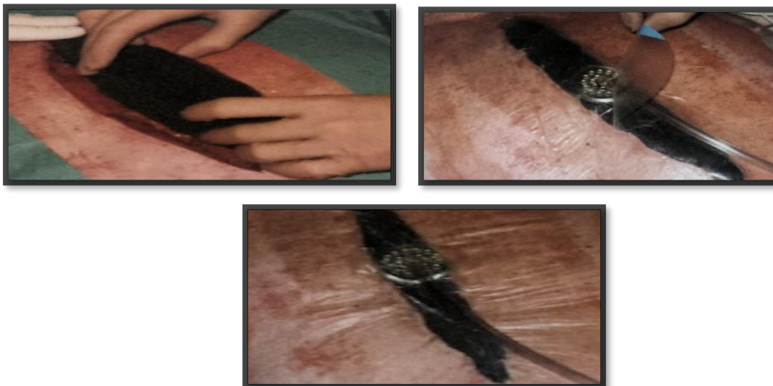
Slika 5. Postavljanje seta za terapiju negativnim tlakom na sternalnu ranu.

Nakon pripreme pacijenta, kirurške obrade rane i izabranog odgovarajućeg materijala pristupa se postavljanju sustava za negativan tlak. (Slika 5) Aplikacija seta za negativan tlak na ranu se može postaviti u ambulantim ili čak i kućnim uvjetima no ipak prvo postavljanje TNT bi trebalo biti izvedeno u operacijskoj sali ili bolnici odnosno u kontroliranim uvjetima koje u drugim mjestima uglavnom nemamo. Naročito se to odnosi na rane kod kojih je potreban opsežan debridman/nekrektomija prije uključenja terapije. Set za negativan tlak postavlja se u sterilnim uvjetima i idealno je da to izvode minimalno dvije osobe. U iznimnim situacijama postavljanje može izvesti jedna osoba „tehnikom nedodirivanja“. Nakon što smo odredili potrebnu veličinu spužve na temelju veličine rane, ista se reže i postavlja direktno na ranu. Neki autori u svojim publikacijama opisuju korištenje vazelinske gaze za određene vrste rana (npr. Mesh graft ) koju prvo postavimo na ranu, a tek potom spužvu. Nakon spužve na cijelu površinu rane te nekoliko centimetara na okolnu kožu lijepi se folija. Na sredini folije (i na sredini spužve) izreže se otvor veličine kovanice na koji se lijepi trac-pad sa cijevi za sukciju. Kada smo sigurni da je sve ispravno postavljeno spajamo cijev za sukciju na uređaj te putem zaslona izabiremo funkcije.