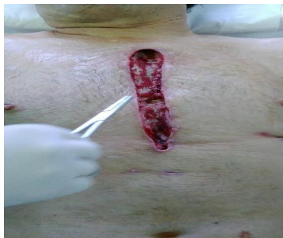
Sl. 9. Rana nakon prve promjene TNT