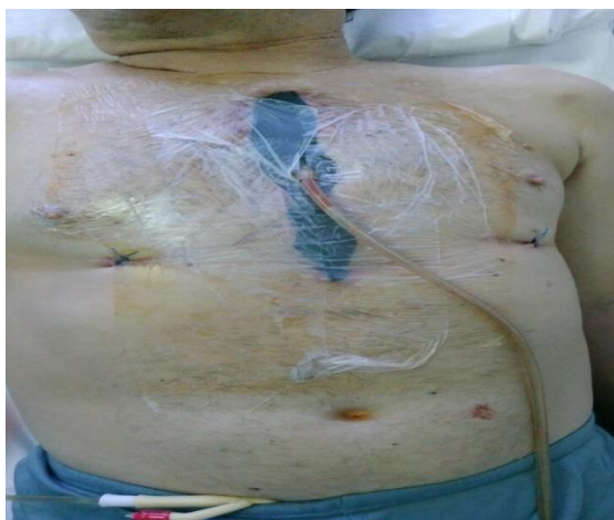
Sl. 8. Prvo postavljanje TNT