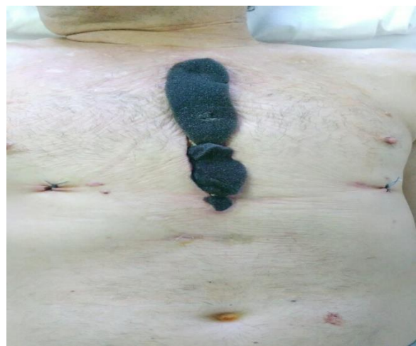
Sl. 7. Postavljanje spužve na sternalnu ranu