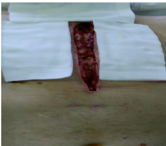
Sl. 6. Sternalna rana nakon debridmana

Efekt negativnog tlaka može se uočiti nakon prve izmjene seta. (Slika 6-12) Nakon debridmana rane apliciran je set za negativan tlak. Prva promjena se izvela treći dan. Nalazi se "čišća" rana sa granulacijskim tkivom. Također je došlo do kontrakcija rubova rane što ju vizualno čini manjom. Nakon prve izmjene seta za prijevaj rezultati terapije su bili zadovoljavajući te su se rubni djelovi rane mogli zatvoriti sekundarnim šavima.