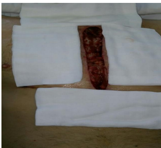
Sl. 10. Rana nakon prve promjene TNT