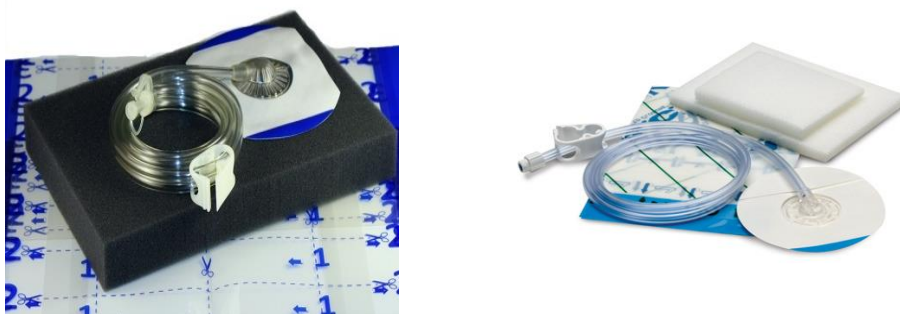
Slika 3. Spužve korištene u terapiji negativnim tlakom

Terapija negativnim tlakom se provodi putem uređaja koji postiže željeni podtlak u rani i apliciran je na samu ranu preko različitih materijala, veličina i oblika. Ovisno o mjestu primjene i tipu rane primjeniti ćemo odgovarajući spužvu ili gazu. Oblik i veličina su tvornički pripremljeni te se mogu korigirati. Set za postavljanje TNT se osim uređaja i spužve/gaze sastoji od folije koja se koristi kao pokrivalo, trac-pada sa cijevi za sukciju, kanistera za kolekciju eksudata i Y konektora po potrebi. Svi potrebni materijali su tvornički pakirani i mjerama odgovaraju samo za taj set i uređaj. Preko zaslona uređaja mogu se korigirati funkcije (jačina sukcije-željeni podtlak, modus rada, podaci o pacijentu, povijest zapisa itd.). Uređaj će alarmirati ako se dogode neočekivane promjene (propusnost zraka, trošenje baterije, potreba za promjenom kanistera) (Willy 2006.) Materijali koji se stavljaju u ranu su semipermeabilni pa održavaju vlažno i toplo okruženje u rani i osiguravaju optimalne uvjete za cijeljenje. (Huljev 2013) Spužve su izrađene od različitog materijala pa tako razlikujemo PU ( polyurethane ) ili "crnu" te PVA ( polyvinyl alcohol ) ili "bijelu" spužvu. (Slika 3)