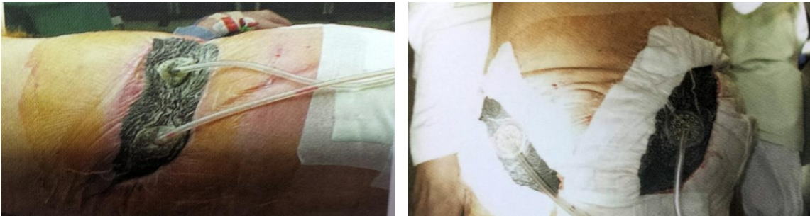
Slika 4. Prikaz TNT sa dva konektora za sukciju spojenih na jednom uređaju. Prema: Willy (2006), str. 329, 336

Y konektori se koriste u slučaju kada imamo više od jednog defekta tkiva i više spužvi i trac-pada spojenih na jedan uređaj ili je na jednoj rani sama površina spužve velika pa se koristi više od jednog trac-pada . (Willy 2006) (Slika 4)