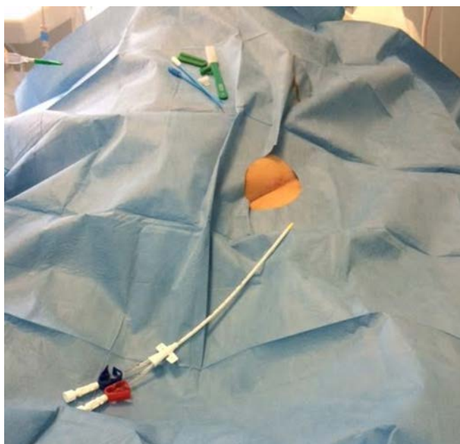
Slika 2. Dijalizni centralni venski kateter preko kojeg se provodi PF

Plazmafereza se provodi putem sigurnog vaskularnog pristupa, najčešće preko dvoluminalnog centralnog venskog katetera s dovoljnim promjerom i čvrstoćom (tzv. dijalizni centralni venski kateter, Slika 2) ili vrlo rijetko putem dvije velike periferne vene.