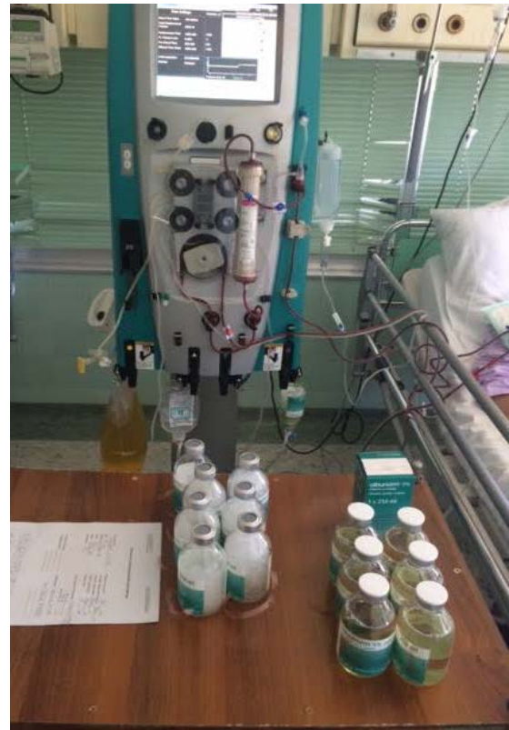
Slika 4. Mobilni stroj za kontinuirano nadomještanje bubrežne funkcije s filterom za PF, proces PF u tijeku.