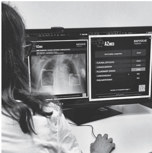
SLIKA 2. FOTOGRAFIJA PRIKAZUJE RADIOLOGA UZ RADNU STANICU KAKO ANALIZIRA SLIKU OBRADENU OD STRANE UMJETNE INTELIGENCIJE. AI SUSTAV AZ MED-A RAYVOLVE IMPLEMENTIRAN JE U KBC-U ZAGREB OD 2023. GODINE.

FIGURE 2. THE PHOTOGRAPH SHOWS A RADIOLOGIST AT A WORKSTATION ANALYZING AN IMAGE PROCESSED BY ARTIFICIAL INTELIGENCIJE. THE AI SYSTEM AZ MED RAYVOLVE HAS BEEN IMPLEMENTED AT UNIVERSITY HOSPITAL CENTRE ZAGREB SINCE 2023.