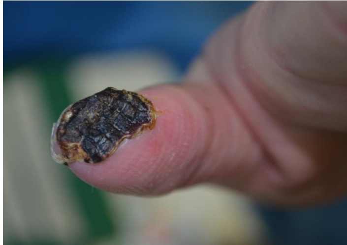
Slika 4 Suha nekroza jagodice lijevog palca

Na kontrolnom pregledu nakon osam tjedana po otpustu iz Klinike, a nakon provedenog liječenja u Dnevnoj bolnici i nakon završene HBOT došlo je do autoamputacije nekrotičnog dijela palca, a zaostao je dobro prokrvljen ulkus koji je spontano iscijelio (Slika 5).