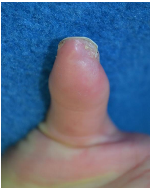
Slika 5 Palac nakon provedene terapije

Na kontrolnom pregledu nakon osam tjedana po otpustu iz Klinike, a nakon provedenog liječenja u Dnevnoj bolnici i nakon završene HBOT došlo je do autoamputacije nekrotičnog dijela palca, a zaostao je dobro prokrvljen ulkus koji je spontano iscijelio (Slika 5).