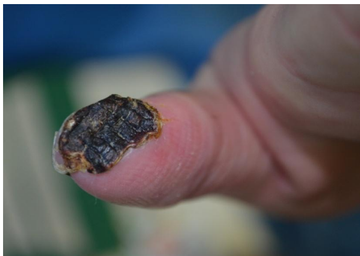
Slika 4 Suha nekroza jagodice lijevog palca

Na kontrolnom pregledu nakon osam tjedana po otpustu iz Klinike, a nakon provedenog liječenja u Dnevnoj bolnici i nakon završene HBOT došlo je do autoamputacije nekrotičnog dijela palca, a zaostao je dobro prokrvljen ulkus koji je spontano iscijelio (Slika 5).