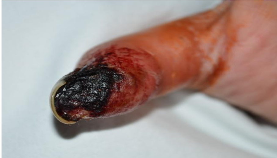
Slika 3 Površinska nekroza jagodice lijevog palca

Zbog hipotenzije u liječenje nije bio uveden blokator kalcijevih kanala. Nakon 17 dana liječenja, bolesnica je u dobrom općem stanju, respiratorno suficijentna, otpuštena na daljnje kućno liječenje. Daljnje liječenje provedeno je hiperbaričnom oksigenoterapijom (HBOT) i redovitom primjenom Ilomedina (1x20 mcg/5h, 5 dana svakih mjesec dana) u Dnevnoj bolnici Zavoda.