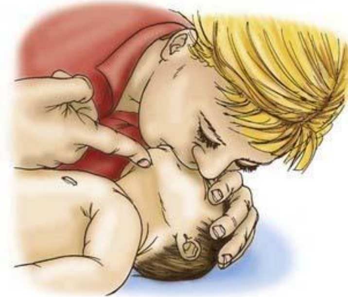
Slika 4. Umjetno disanje “usta na usta i nos”.

koristi pri umjetnom disanju jest metoda “usta na usta i nos” kod dojenčadi te metoda “usta na usta” kod starije djece.