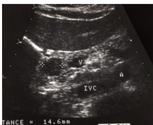
Slika 1. Preoperativni ultrazvučni nalaz inzulinoma (8)

Na slici 1 možemo vidjeti ultrazvučni nalaz inzulinoma. Tumor se nalazi između dviju oznaka zvjezdice (*), te mjeri 14.6 mm u glavi pankreasa. Na slici su još vidljive portalna vena (V), donja šuplja vena (IVC) te aorta (A). (8)