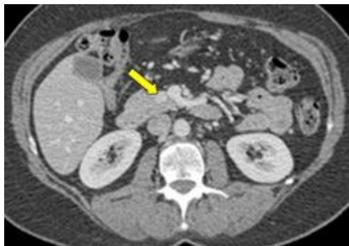
Slika 3. Prikaz inzulinoma na CT-u (8)

Na slici 3 vidimo CT snimku inzulinoma, (hiperdenzna točka pokraj strelice) koji se nalazi na spoju glave i uncinantnog nastavka gušterače. Desno od inzulinoma nalazi se portalna vena. (8)