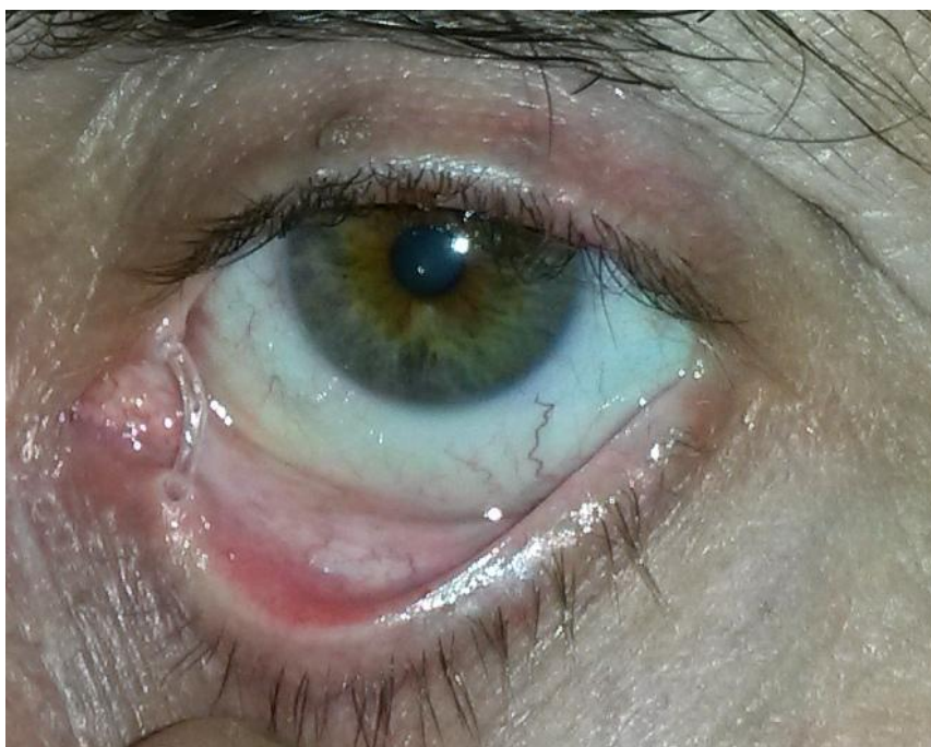
Slika 8. Stanje nakon DCR zbog funkcionalne epifore – vidi se silikonska cjevčica koja prolazi kroz oba suzna kanalića u nos.

Osim toga, drugi uzroci funkcionalne epifore, kao npr. poremećaji vjeđa u smislu ektropija ili entropija vjeđa, mogu se liječiti kirurškim pokušajem vraćanja napetosti vjeđa. Nadalje, stenoze suznih točkica, koje također uzrokuju funkcionalnu epiforu, mogu se liječiti postavljanjem privremenih silikonskih sustava. Epifora kod pareze facijalisa nastoji se kirurški liječiti tako da se pospeši normalna dinamika gornje vjeđe pomoću ugradnje zlatnih utega te vraćanjem normalne pozicije i napetosti donjoj vjeđi.