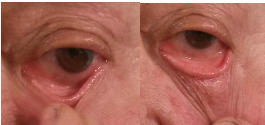
Slike 3 i 4. Testovi laksiteta vjeđa – procjena suzne pumpe.

Snap back testom ispituje se brzina vraćanja vjeđe na normalnu poziciju nakon što je prstom povučemo od oka prema obrazu.