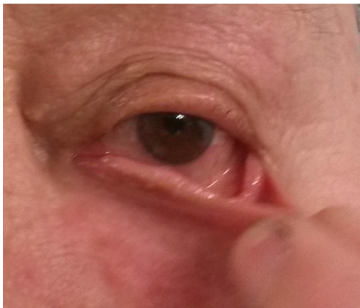
Slika 2. Test ispitivanja laksiteta donje vjeđe.