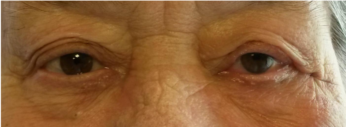
Slika 9. Stanje nakon zatezanja donje vjeđe lijevo – vidi se uredna pozicija i napetost donje vjeđe s poboljšanom funkcijom suzne pumpe.