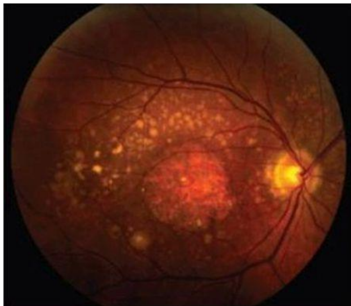
Slika 3. Fundus fotografija: geografska atrofija – oštro ograničeno okruglo ili ovalno područje hipopigmentacije. Unutar atrofičnog područja koroidalne su krvne žile jasnije vidljive zbog odsutnosti RPE-a.