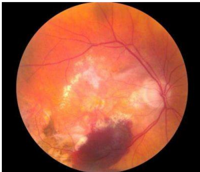
Slika 4. Fundus fotografija: uznapredovala neovaskularna forma AMD-a. Vidljivo je krvarenje iz novonastalih krvnih žila.