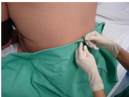
Slika 1. Epiduralna anestezija postupka

Skrotum se očisti antiseptičkim sredstvom, te se zatim temeljito ispiru fiziološkom otopinom kako bi se uklonio rezidualni antiseptik. Pod lokalnom anestezijom palpira se glava pasjemenika i stabilizira se između palca i kažiprsta. Zatim se izvodi punkcija (direktno kroz kožu skrotuma) pomoću 26-G iglom pričvršćenom za tuberkulinsku špricu. U njoj se nalazi 0,1 ml medija za ispiranje sjemena. Iglu treba polagano i nježno uvoditi u kanal epididimisa. U isto vrijeme asistent povlači dršku šprice i lagano stvara usisnu silu. Ponekad se mogu opaziti kapljice tekućine kako ulaze u špricu, ali je u nekim slučajevima aspirat iz epididimisa tako oskudan da se uopće ne vidi golim okom. Sadržaj šprice se nježno izbacuje u zdjelicu i pregledava se za nalaz spermija. Ako pokretni spermiji nisu pronađeni, zahvat se ponavlja na drugom mjestu glave epididimisa. Kod opstruktivne azoospermije kvalitetniji spermiji se dobivaju iz proksimalnog dijela pasjemenika, dok u distalnim dijelovima kvaliteta pada. Budući da je ova procedura „na slijepo“, ponekad treba izvršiti više zahvata dok se ne dobiju spermiji odgovarajuće kvalitete.