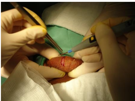
Slika 3. Početna incizija skrotuma

Pod lokalnom anestezijom radi se incizija skrotuma, zatim incizija tunika te se vrši lagani pritisak na testis. Posljedično će se prikazati tkivo testisa čiji se dio izrezuje i uzima kao uzorak. Konačno se šavovima zatvaraju ranije napravljeni rezovi.