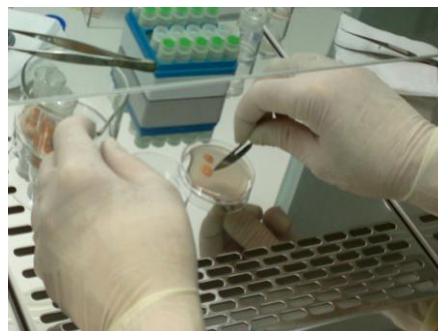
Slika 6. Priprema uzoraka za daljnju