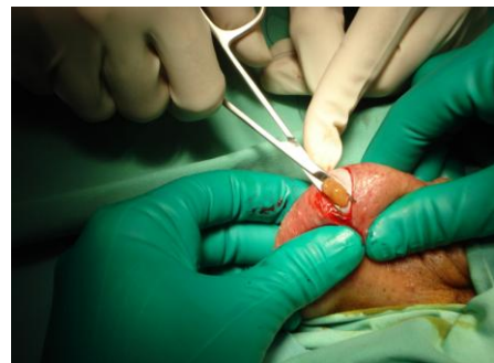
Slika 4. Biopsija tkiva testisa