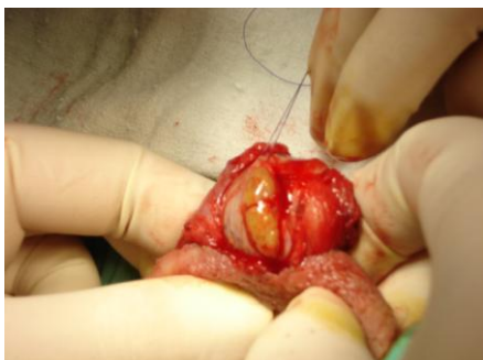
Slika 5. Šivanje incizije obradu