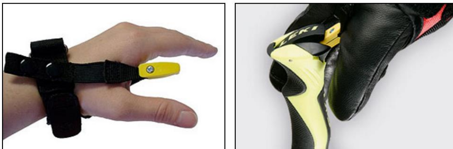
Slika 4. Trigger varijanta vezice skijaškog štapa (52)

Ozljede palca nose trećinu ozljeda gornjih ekstremiteta. Ozljeda nosi ime " Skijaški palac ". Radi se o ozljedi ulnarnog kolateralnog ligamenta u prvom metakarpofaringealnom zglobu. U situaciji kada skijaš pada na šaku sa štapom koji nije otpustio dešava se traumatska hiperabdukcija i ekstenzija metakarpolalangealnog zgloba jer se drška štapa ponaša kao uporište za bazu palca. Posljedica čega je oštećenje ulnarnog kolateralnog ligamenta. Stoga se u novije vrijeme pojavljuje sve veća ponuda trigger varijante vezice skijaškog štapa (slika 4) kao i intenzivno podučavanje pravilnog držanja klasične vezice skijaškog štapa (slika 5).