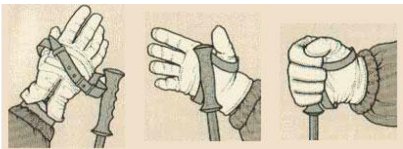
Slika 5. Držanje vezica i drške štapa (53)