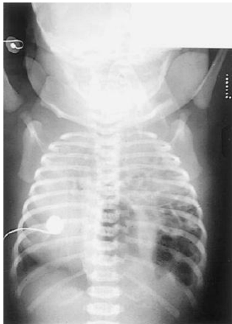
SLIKA 2. DIJAFRAGMALNA HERNIJA (ljevostrani Bochdalekov defekt)

Slika preuzeta iz MacKinlay GA (2008), Surgical pediatrics, McIntosh Neil, ur. Forfar and Arneil's Textbook of Pediatrics, London, Elsevier Limited