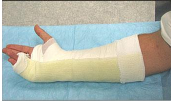
Slika 8.4.1. Ulnarna longeta postavljena na sloj vate I presvlake od trikoa, preuzeto iz: Boyd AS et al. (2009), Principles of Casting and Splinting, Figure 6.