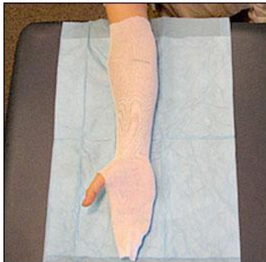
Slika 8.3.1. Postavljanje presvlake od trikoa (stockinett), preuzeto iz: Boyd AS et al. (2009), Principles of Casting and Splinting, Figure 2.

Kako bi se ozlijeđeni ud pripremio za postavljanje longete, prvo se mora izmjeriti njegova duljina. To nam je potrebno kako bi mogli staviti dobru duljinu presvlake od trikoa (eng. stockinette), koja ide na ozlijeđeni ud prije stavljanja vunenog obloga, sadre ili fiberglassa. Presvlaka mora biti 10 cm dulja od krajeva longete. Kasnije, nakon što se stavi vuneni oblog, sadra ili fiberglass krajevi presvlake od trikoa prebacuju se preko krajeva gipsa kako bi dobili glatke i mekane krajeve. Presvlaka od trikoa mora biti dobro zategnuta, ali ne prejako i također ne smije imati nikakvih nabora, a pogotovo ne na fleksornim dijelovima uda. Presvlake od trikoa različitih su širina, s obzirom na to da li se postavljaju na gornje ili na donje udove (Boyd AS et al., 2009).