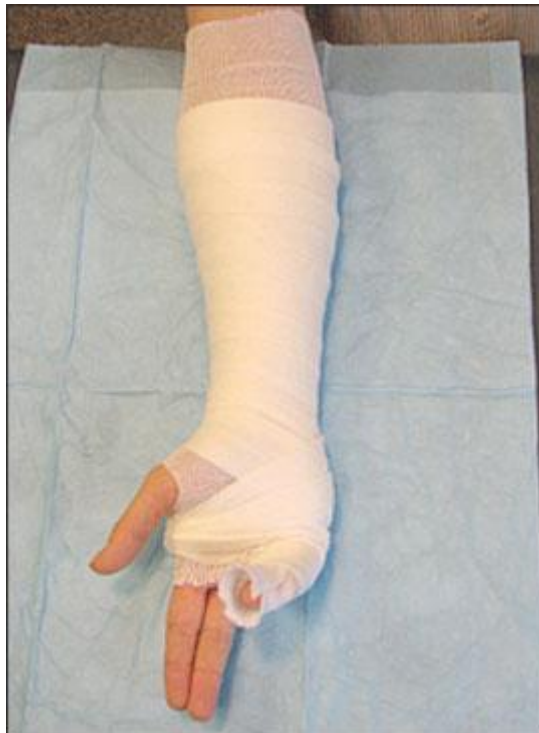
Slika 8.3.2. Sloj vune (padding) koji se oblaže na presvlaku od trikoa, preuzeto iz:

Nadalje slojevi vate stavljaju se na presvlaku od trikoa, kako bi se izbjegla maceracija kože ozlijeđenog uda i kako bi se taj sloj akomodirao na nastanak otekline. Slojevi vate stavljaju se cirkularno na ozlijeđeni ud, od jednog do drugog kraja uda na koji će se postaviti longeta ili cirkularni gips, i to na način da svaki idući sloj prekriva 50% prethodno stavljenog sloja vate. Ta tehnika postavljanja odmah će dati dvostruki sloj vate. Naravno uvijek se mogu dodati dodatni slojevi ukoliko za time postoji potreba. Ako se tehnika pravilno izvodi dobivaju se dva do tri sloja vate, koja bi se trebali protezati 2-3 cm iznad oba kraja longete ili cirkularnog gipsa (Prpić I, 1989).