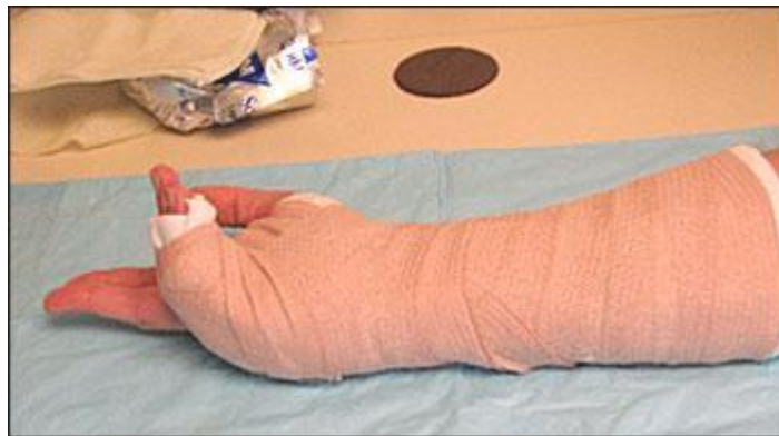
Slika 8.4.2. Elastična bandaža postavljena na longetu, preuzeto iz: Boyd AS et al. (2009) Principles of Casting and Splinting, Figure 7.