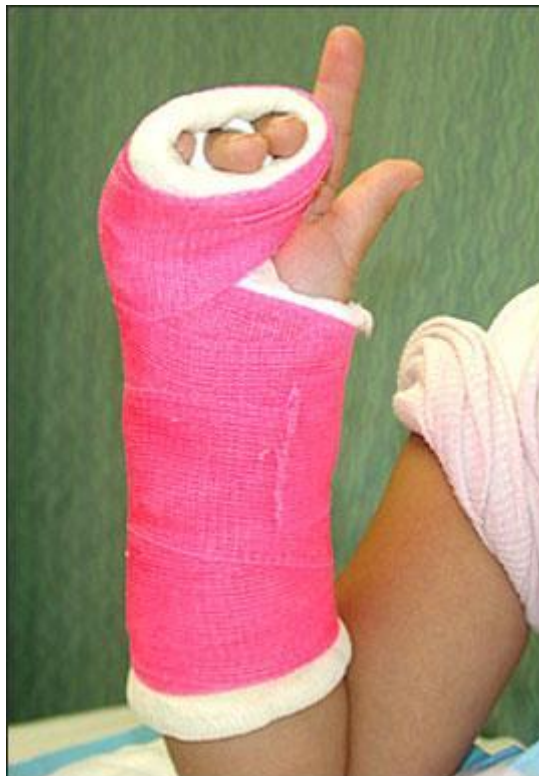
Slika 8.5.1. Ulnarni cirkularni gips, Boyd AS et al. (2009) Principles of Casting and

Cirkularni gips postavlja se tako da se svaki sloj materijala (sadra ili fiberglass), postavlja tako da svaki idući sloj prekriva 50% prethodno stavljenog sloja. Kod cirkularnog stavljanja slojeva treba izbjegavati prekomjernu tenziju sadre ili fiberglassa na ozlijeđeni ud, jer može doći do konstrikcije uda i oštećenja neurovaskularnih struktura. Nadalje sloj koji je prelabavo stavljen ili je ispod njega preveliki sloj vate, može dovesti do značajnih ozljeda kože (npr abrazije). Kod postavljanja cirkularnog gipsa, presvlaka od trikoa i sloj vate se prebacuju preko ruba gipsa prije postavljanja posljednjeg sloja materijala za gipsanje i njegova formiranja oko ozlijeđenog uda (Boyd AS et al., 2009).