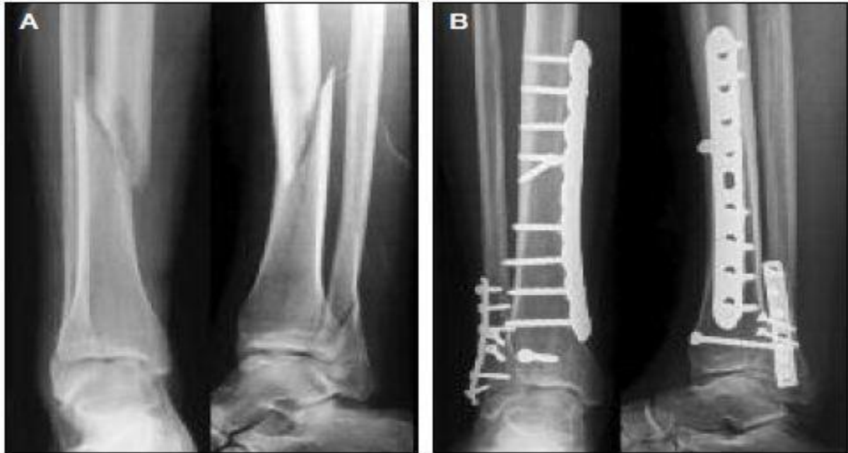
Slika 6.1.1. Primarno cijeljenje prijeloma nakon osteosinteze prijeloma tibie I fibule; preuzeto iz: Medicographia (2014) Osteoporosis: the fracture cascade must be stopped; Vol 36, No. 2, str. 157.

diferenciraju u osteoblaste i oni zatim produciraju lamelarnu kost koja se stvara na površini svake pukotine. Pukotinsko cijeljenje je inicijalni proces kod ovog tipa cijeljenja i traje oko 3-8 tjedana te se na njega nastavlja proces sekundarne remodelacije kosti i kontaktnog cijeljenja prijelomne pukotine (Shapiro F, 1998).