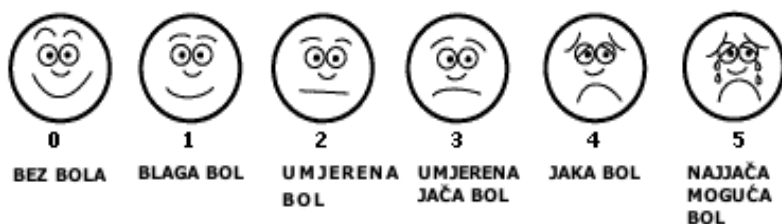
Slika 1. Ljestvica izraza lica

Ljestvica izraza lica (Wong- Baker faces rating scale) koja koristi slikovne prikaze, od lica s osmjehom do lica sa suzama, pogodna je za djecu, starije i osobe s kojima je komunikacija ograničena (Slika 1). Od bolesnika se traži da odabere prikaz koji najviše odgovara njegovom trenutnom stanju i boli (Butterworth,Mackey i Wasnick, 2013).