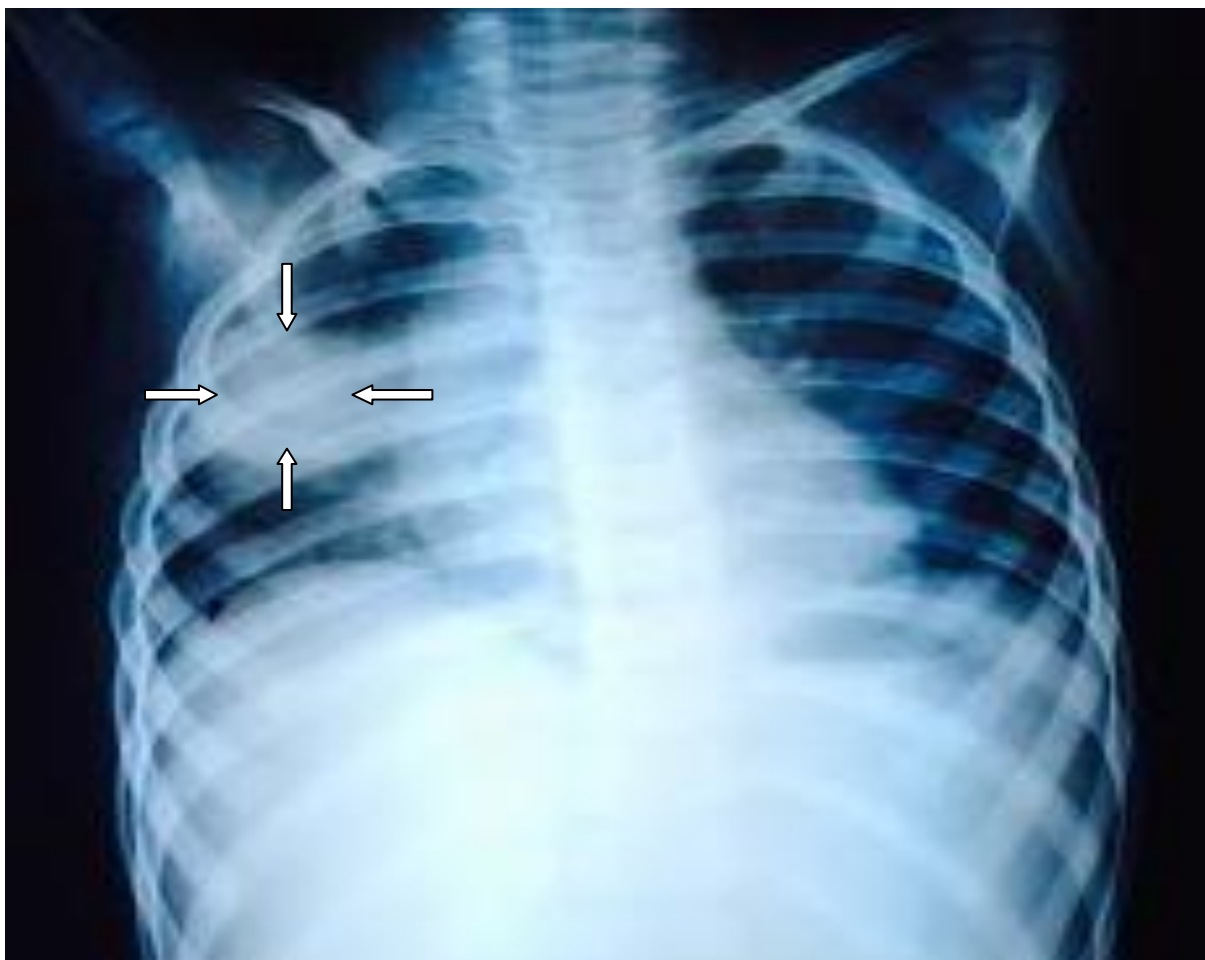
Slika 3. Okrugla pneumonija kod djevojčice u dobi od 2.5 godine.