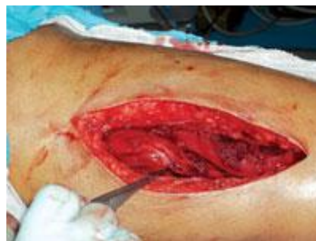
Slika 5. Fasciotomija

(Slike preuzete s: http://nurse-practitioners-and-physician-assistants.advanceweb.com/Continuing-Education/CE-Articles/Acute-Lower-Extremity-Compartment-Syndrome.aspx )