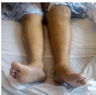
Slika 4. Compartment sindrom potkoljenice desne noge

Nekroza mišićnog tkiva te masivni edem mišića mogu dovesti do teških sistemskih komplikacija koje se nastoje izbjeći pravovremenim kirurškim postupkom te konzervativnim liječenjem. Hipovolemija i hemokoncentracija zbog edema, akutna bubrežna insuficijencija zbog izravnog toksičnog učinka raspadnih produkata te ishemija zbog vazokonstriktornih medijatora, insuficijencija pluća, ARDS, DIK... (Petrunić U: Šoša et al. 2007).