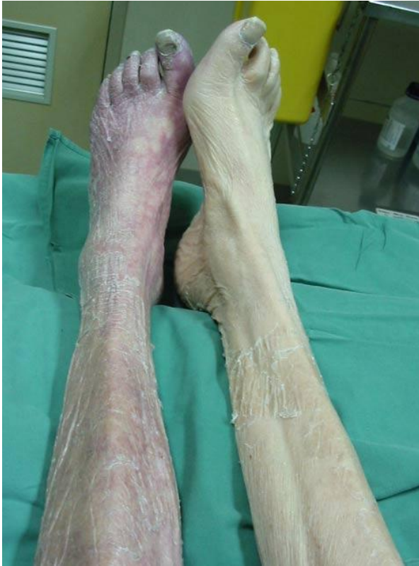
Slika 1. Akutna ishemija desne noge

promjenama jer određuju algoritam postupka i liječenja akutne ishemije. Znakovi ireverzibilne ishemije su: anestezija, plegija, rigor te neizblijedivi lividitet (Petrunić U: Šoša et al. 2007).