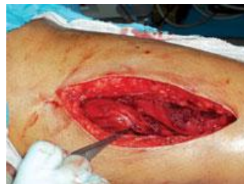
Slika 5. Fasciotomija

(Slike preuzete s: http://nurse-practitioners-and-physician-assistants.advanceweb.com/Continuing-Education/CE-Articles/Acute-Lower-Extremity-Compartment-Syndrome.aspx )