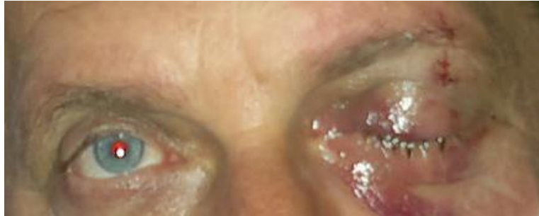
Slika broj 9. Traumatska ptoza lijevog oka u odrasle osobe

Na temelju težine ozljede, traumatske ptoze se dijele na blage, umjerene i teške.