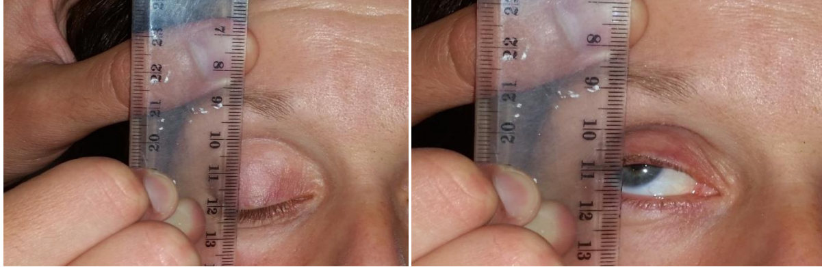
Slika broj 9. Mjerenje funkcije levatora uz stabilizaciju obrve