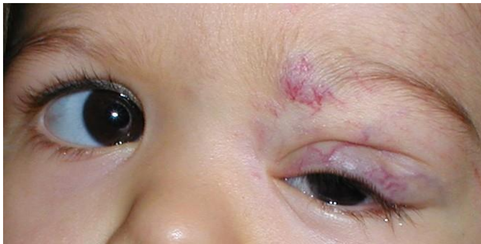
Slika broj 6. Mehanička ptoza u djece – hemangiom orbite i periokularnog područja