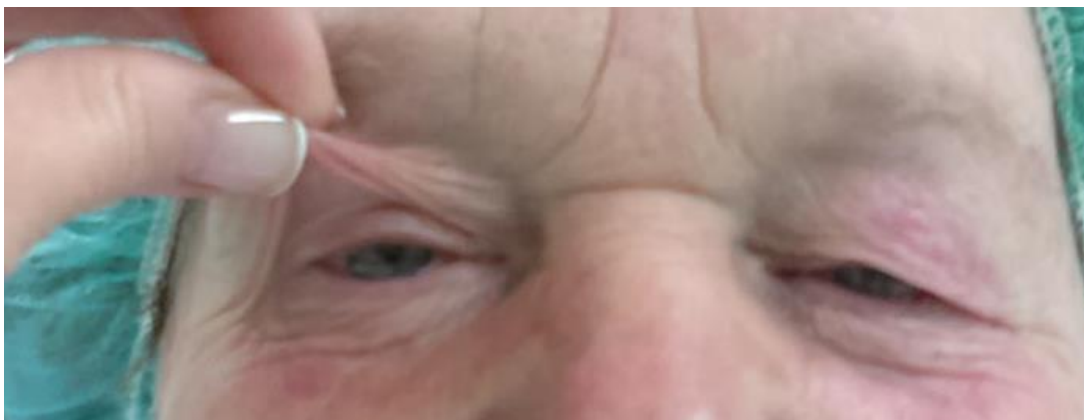
Slika broj 1. Dermatohalaza

Najjednostavniji način podjele ptoza je na kongenitalne i stečene. Međutim, ono je nedostatno pa se koristi i podjela prema uzroku nastanka na neurogene, miogene, aponeurotske, mehaničke i traumatske. Dodatno treba razlikovati pseudoptozu koja može izgledati kao prava spuštена vjeđa, no ona to ipak nije. U takvim slučajevima vjeđa može biti abnormalno nisko položena u stanjima kao što su hipotropija, enoftalmus, mikro i anoftalmus, hemifacijalni spazmi, blefarospazmi, vjeđne apraksije kod otvaranja oka, miotonije vjeđe i slično. (4) Osim toga, kontralateralna retrakcija gornje vjeđe (kongenitalna, Gravesova bolest) može izazvati reaktivnu ptozu tj. pseudoptozu vjeđe na drugome oku zbog takozvanog Heringovog zakona recipročne inervacije. (4) Ponekad ju imitira i dermatohalaza, stanje koje karakterizira gubitak elasticiteta i tonusa kože starenjem, a očituje viškom kože koji nadsvođuje slobodni rub vjeđe. (3)