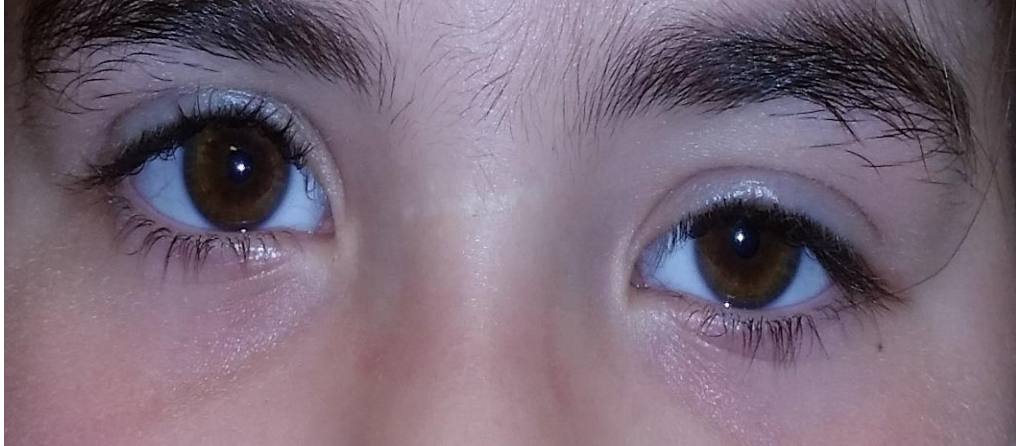
Slika broj 4. Ptoza lijevog oka u Marcus Gunn sindromu

Karakterizira ga ptoza pri rođenju, obično unilateralna i intermitentna. (7) Do retrakcije gornje vjeđe dolazi nakon stimulacije ipsilateralnog pterigoidnog mišića, a to je moguće prilikom žvakanja, smijanja ili normalnih pokreta čeljusti. (4) Ovakve promjene najprije uočava majka kod hranjenja ili njege djeteta. Kao razlog ove sinkinezije navodi se neprirodan spoj između motornih vlakana okulomotornog živca za inervaciju mišića podizača vjeđa te motoričkih vlakana trigeminalnog živca za inervaciju vanjskog pterigoidnog mišića. (4)