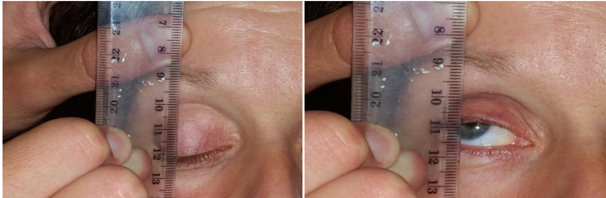
Slika broj 9. Mjerenje funkcije levatora uz stabilizaciju obrve