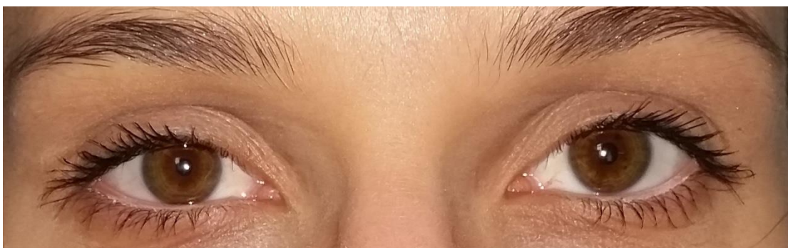
Slika broj 8. Ptoza desnog oka u stečenom Hornerovom sindromu; gore – preoperativno, dolje – postoperativno

Mijastenija gravis je autoimuna bolest u kojoj se stvaraju protutijela na vlastite receptore neuromuskularne spojnice. Vezanjem protutijela za receptore blokiraju se signali i procesi potrebni za normalnu kontrakciju mišića pa je njihova funkcija oslabljena i brže dolazi do zamora. Otprilike 10% ljudi s tom bolešću ima i tumor timusa, timom pa je potrebno obradom tu mogućnost isključiti, ako je to moguće. Uz to se mogu pojaviti i ostale autoimune bolesti poput Gravesove bolesti, SLE, reumatoidnog artritisa i slično. Bolest je često generalizirana i sistemska, a rani znakovi mogu uključivati oftalmološke promjene poput ptoze i diplopije. Ako se promjene izolirano jave na vanjskoj muskulaturi oka, riječ je o okularnoj mijasteniji gravis. Do privremene ptoze, u trajanju od par tjedana, može dovesti i injekcija botulinum toksina u čelo ili orbitalnu regiju što se koristi za ublažavanje blefarospazma ili redukciju bora, a