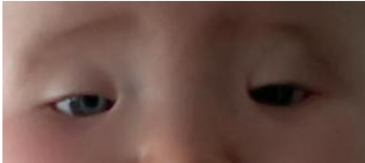
Slika broj 2. Dijete s BPES-om

učestalo pojavljuje, najčešće zbog nenormalne inervacije vanjskih mišića oka, poput izoliranog Duane sindroma, BPES-a (blepharophimosis-ptosis-epicanthus inversus syndrome), kongenitalne fibroze vanjskih očnih mišića te kongenitalnog mijasteničkog sindroma.