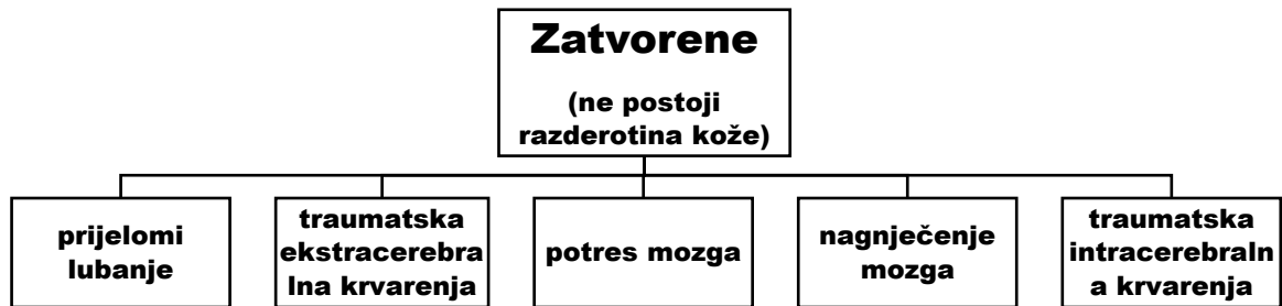
Dijagram 2. podjela zatvorenih kraniocerebralnih ozljeda

Zatvorene kraniocerebralne ozljede su obilježene ozljedom mozga i prijelomom kosti ali bez razderotine kože.