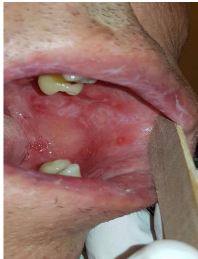
Slika 5. Manje ulceracije okružene eritemom na bukalnoj sluznici kao distinktivni znak cGVHD. Dijagnostički znak su lezije slične lichenu planusu na usnicama i obraznoj sluznici.