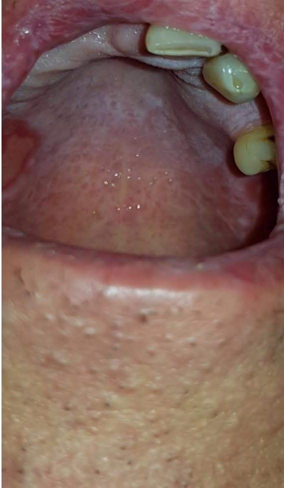
Slika 2. Lezije slične lichenu planusu na gornjoj usni i na sredini tvrdog nepca su dijagnostički znak za oralnu cGVHD. Manja ulceracija na tvrdom nepcu i mukokele na mekom nepcu su distinktivni znak oralne cGVHD.