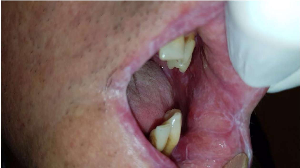
Slika 4. Lezije slične lichenu planusu na sluznici kuta usana kao dijagnostički znak za oralni cGVHD.