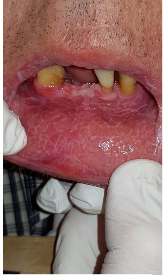
Slika 3. Lezije slične lichenu planusu na donjoj i gornjoj usni su dijagnostički znak za oralnu cGVHD.