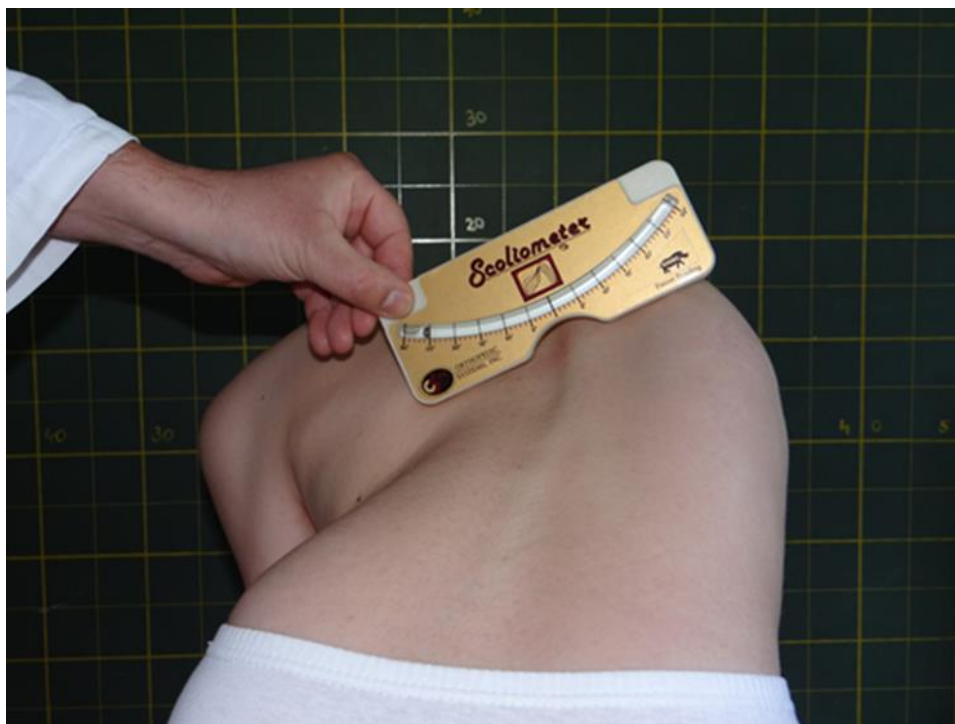
Slika 1. Mjerenje rotacije trupa skoliometrom.