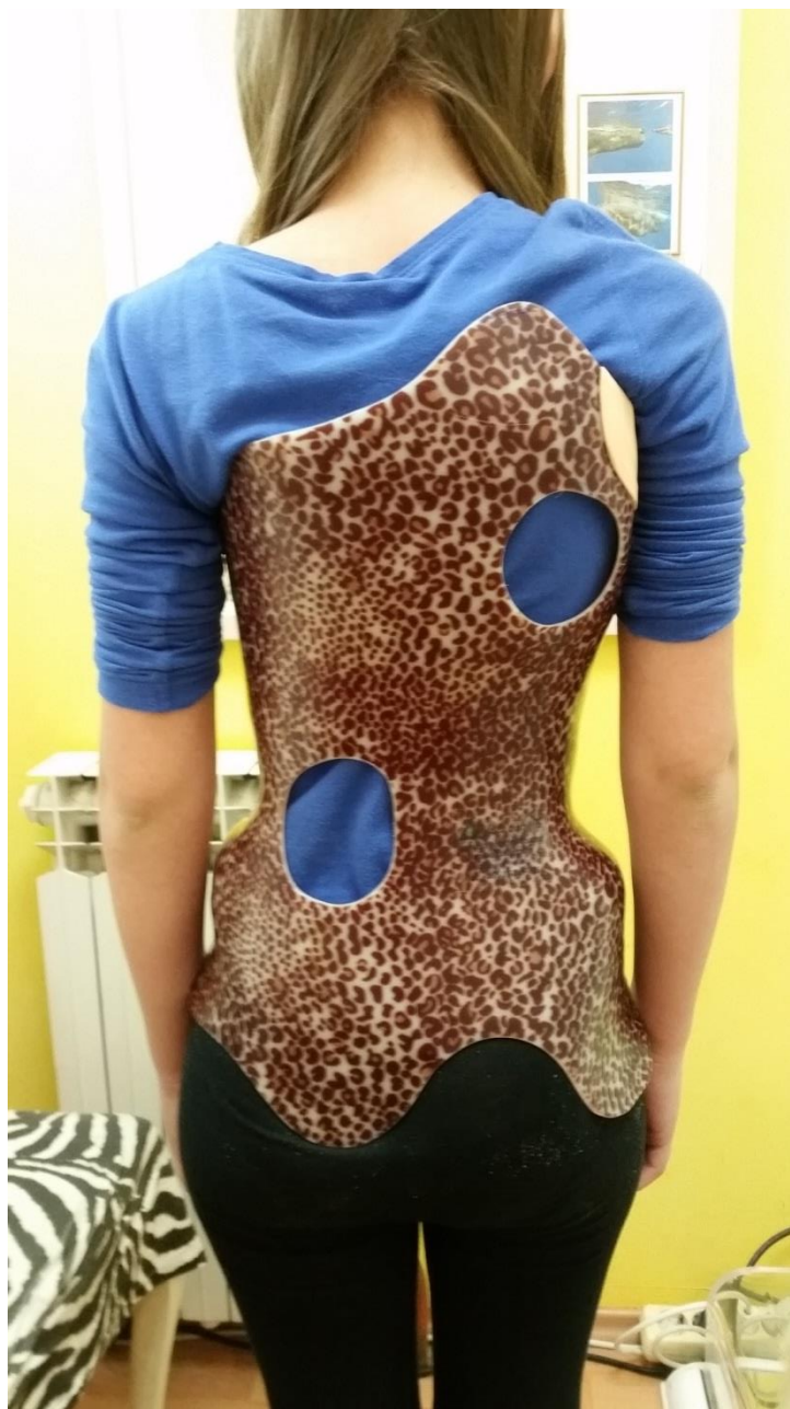
Slika 5. Monoblok ortoza.