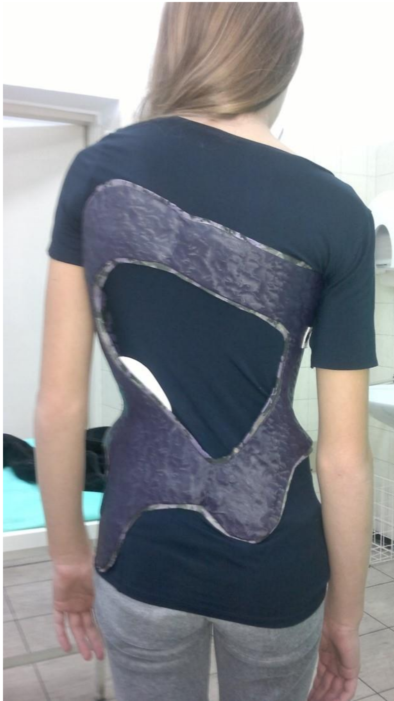
Slika 7. Cheneau monoblok ortoza od karbonskih vlakana.