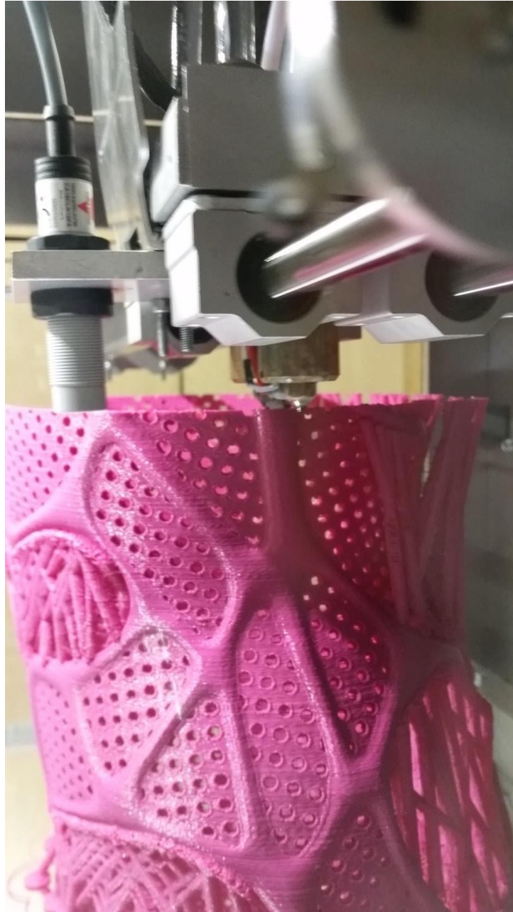
Slika 6. Proces 3D printanja ortoza.