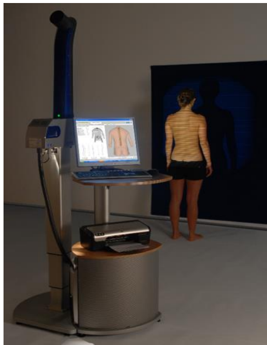
Slika 3. Formetric sustav.

Površinska topografija se sastoji od uređaja koji projicira optički raster, kamere koja to snima i programa koji radi automatsku analizu slika. Snimanje površinske topografije se izvodi na način da pacijent stoji, a na leđa mu se projicira optički raster (mreža). Kao što je navedeno, kamera to snima, a program analizira. Oprema se razlikuje u tehnici prikupljanja slike, rezoluciji slike, programu za obradu, vremenu snimanja i slično. Cilj površinske topografije je kvantificirati veličinu nepravilnosti trupa (9). Trenutno postoji nekoliko različitih sustava (InSpeck, ISIS, Quantec i Formetric) koji služe za mjerenje i analizu površinske topografije tijela (11).