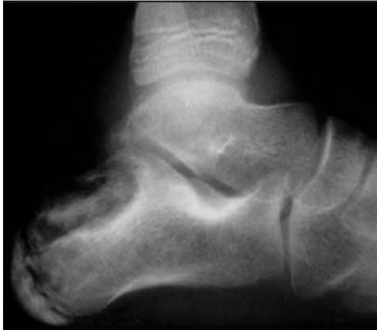
Slika 7. Tuberkuloza kalkaneusa na rendgenskoj snimci stopala (preuzeto 05.05.2018. s http://www.scielo.org.za/scielo.php?script=sci_arttext&pid=S1681-150X2012000200004 )

Osteomijelitis također može nastati zbog ubodnih rana u području stopala. U 0,6-14,8% slučajeva doći će do infekcije, od čega osteomijelitis čini 0,6-1,8%, a šansa je veća ako je strano tijelo probilo plantarnu fasciju. Najčešći uzročnik je Pseudomonas aeruginosa .(41) Do infekcije najčešće dolazi zbog neadekvatne primarne obrade rane. Simptomi se pojavljuju nakon nekoliko dana do nekoliko mjeseci, ponekad i više, a uključuju znakove lokalne upale bez sistemskog odgovora.(42) Kada dođe do znakova osteomijelitisa potrebno je napraviti rendgenogram, scintigrafiju, CT ili MR da bi se potvrdila dijagnoza. Liječi se antibioticima i kirurškim debridmanom.(41)