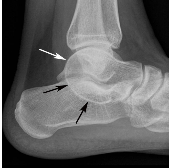
Slika 4. „C znak" označen strelicama na rendgenskoj snimci stopala (preuzeto 03.05.2018. s https://www.mypacs.net/cases/61224534.html )

CT je zlatni standard za postavljanje dijagnoze tarzalne koalicije. Kalkaneonavikularna koalicija se vidi kao sužavanje zglobne pukotine, reaktivna skleroza, proširenje prednjeg i stražnjeg dijela kalkaneusa i zaokruženje lateralnog talusa. Na talokalkanealnu koaliciju (slika 5.) upućuju koštani most u zglobnoj pukotini, nepravilni korteksi, proširenje sustentaculum tali i znak „pijanog konobara" (dizmorfični sustentaculum tali i pomak zglobne pukotine). Osim što CT potvrđuje dijagnozu, pruža uvid u točnu lokalizaciju i veličinu deformacije, procjenu degenerativnih promjena poput subhondralne skleroze i cista te je važan za preoperativno planiranje.(20)