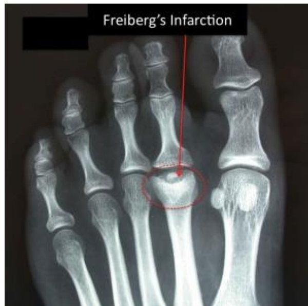
Slika 6. Rendgenska slika stopala: označen defekt glave 2. metatarzalne kosti kod Freibergove bolesti

moгу se pojaviti metatarzalgija, skraćenje prsta, deformacije i smanjen opseg pokreta u zglobu.(32)