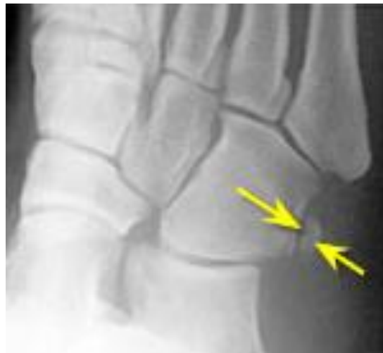
Slika 2. Kosa rendgenska snimka stopala: os peroneum označena strelicama (preuzeto 05.05.2018. s http://www.foot-pain-explained.com/os_peroneum.html )

veliki tuberculum peroneale na kalkaneusu. Bol je lokalizirana, ali može se širiti i proksimalno duž tetive. Pojačava se u plantarnoj fleksiji, kao i pri inverziji i adukciji što čini poteškoće pri hodanju. Dijagnoza se postavlja kosom radiološkom snimkom (slika 2.), a mogu se koristiti i scintigrafija i CT. Ozljede peronealne tetive mogu se dijagnosticirati ultrazvukom koji je jednostavna i jeftina metoda pa se najčešće koristi, ali najbolje se vide na MR-u. Konzervativno liječenje, koje uključuje imobilizaciju longetom, trakama ili zavojima, je najučinkovitije ukoliko se s liječenjem započne unutar mjesec dana od nastanka simptoma. Moguća je i kirurška intervencija koja uključuje uklanjanje os peroneum i tenodeza tetive m. peroneus longus. U slučaju prevelikog tuberculum peroneale on se također uklanja.(15)