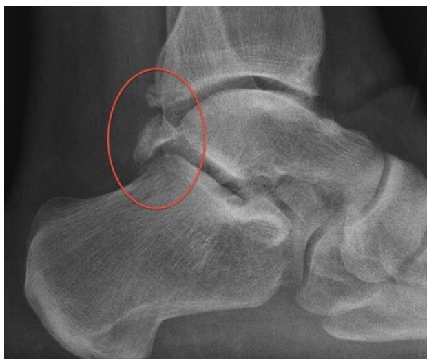
Slika 3. Lateralna rendgenska snimka stopala: zaokružena os trigonum (preuzeto 05.05.2018. s https://hipfootankle.com/problems-treated/posterior-impingement-os-trigonum-trigonal-process/ )